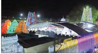
ఆలయంలో ప్రత్యేక పూజలు నిర్వహిస్తారు. ఉగాది రోజున ప్రారంభమయ్యే ఉత్సవాలు 6వ తేదీ కల్యాణంతో ముగుస్తాయి.

తేదీ నుంచి ప్రారంభమైన ఉత్సవాలు తొమ్మిది రోజుల పాటు ఏప్రిల్ 6వ తేదీ వరకు జరుగుతాయి. 6వ తేదీ ఆదివారం రాముల వారి కల్యాణం అంగరంగ వైభవంగా నిర్వహించనున్నారు. కల్యాణాన్ని తిలకించేందుకు జోగి నులు, భక్తులు పెద్ద సంఖ్యలో తరలివస్తారు. ఆలయం గెస్ట్ హౌస్ ముందు ప్రత్యేకంగా ఏర్పాటు చేసిన మంటపంలో కల్యాణ తంతు జరుగుతుంది. ఉత్సవాలకు రాజన్న ఆలయాన్ని రంగు రంగుల విద్యుత్ దీపాలతో ఆలంకరించారు. ఉత్సవాలు జరుగుతున్న 9 రోజుల పాటు