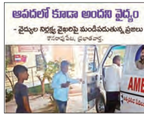
అపదలో కూడా అందరినీ వైద్యం - వైద్యుల నిర్లక్ష్య వైఖరిని మండిపడుతున్న ప్రజలు కోనరావుపేట, ప్రభాతవార్త.

ఈ నెల 29వ శనివారం వార్త జాతీయ దినపత్రికలో 'అపదలో కూడా అందరినీ వైద్యం' అనే శీర్షికన ప్రచురించబడిన కథనానికి స్పందన లభించింది. మండల కేంద్రంలోని ప్రభుత్వ ఆసుపత్రిలో అపదలో కూడా వైద్యం అందడం లేదని, రాత్రి సమయంలో వరి పొలంకు నీరు