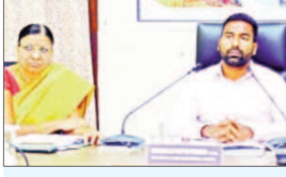
పంచాయతీరాజ్ ఇంజనీరింగ్ శాఖ అధికారులు