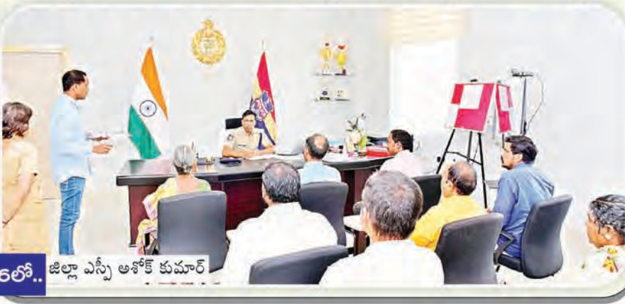
16లో.. జిల్లా ఎస్సీ ఆఫీస్ కుమార్