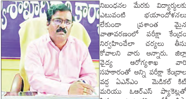
నిబంధనల మేరకు విద్యార్థులకు ఎటువంటి భయాందోళనలు లేకుండా ప్రశాంత మైన వాతావరణంలో పరీక్షా కేంద్రం నిర్వహించేలా చర్యలు తీసుకోవాలని వారు అన్నారు. జిల్లా వైద్య ఆరోగ్యశాఖ వారి సహకారంతో అన్ని పరీక్షా కేంద్రాల వద్ద ఏఎన్ఎం మెడికల్ కిట్ మరియు ఓఆర్ఎస్ వ్యాక్సిన్లతో సిద్ధంగా ఉంటారని, ఆర్బిఎస్ డిపార్ట్మెంట్ వారు పరీక్షా సమయానికి గంట ముందు మరియు అనంతరం బస్సులు అందుబాటులో ఉండేట్లుగా చర్యలు తీసుకోనున్నట్లు వారు తెలిపారు. విద్యార్థులు ముందస్తుగా హాల్ టికెట్లు ప్రధానోపాధ్యాయుల వద్ద తీసుకొని ఒకరోజు ముందుగా పరీక్షా కేంద్రాన్ని సందర్శించాలని మరియు ప్రతిరోజు పరీక్షకు గంట ముందుగా పరీక్షా కేంద్రానికి చేరుకోవాలని వారు అన్నారు. విద్యార్థులు ఎవరి పెన్నులు పెన్సిల్స్ వారే తెచ్చుకోవాలని పరీక్ష సమయం మధ్యలో పక్కన ఉన్నటువంటి విద్యార్థులకు ఎటువంటి ఆటంకాలు కలిగించకూడదని వారు అన్నారు.