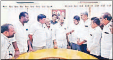
సాసైటీల ద్వారానే వరి ధాన్యం కొనుగోళ్లు జరపాలని సాసైటీ చైర్మన్లు, పాలక వర్గ సభ్యులు

- ప్రభుత్వ విప్ కు సాసైటీ చైర్మన్ల వినతి వేములవాడ, ప్రభాతవార్త.