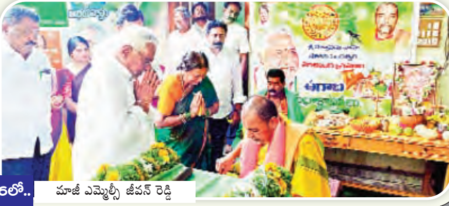
16లో.. మాజీ ఎమ్మెల్యే జీవన్ రెడ్డి