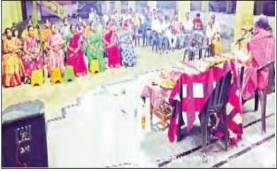
విశ్వపసు నామ సంవత్సర ఉగాది వేడుకలను

మండల వ్యాప్తంగా ప్రజలు ఘనంగా జారుకున్నారు. హిందూ నూతన సంవత్సరం ఉగాది పర్వదినం సందర్భంగా ప్రజలు ఆలయాలకు వెళ్ళి దైవ దర్శనం చేసుకున్నారు ఆలయ ఆర్చకులు ప్రత్యేక పూజలు నిర్వహించారు. సమ్మిడిగా వర్షాలు కురిసి, ప్రాజె క్షులు నీటితో కళకళలాడాలని, పంటలు బాగా పండాలని, రైతులు క్షేమం గా ఉండాలని కోరుకున్నారు. గొల్లపల్లి మండల కేంద్రంలోని శ్రీ కళ్యాణ రామచంద్రస్వామి ఆలయం, శ్రీ భక్తాంజనేయ స్వామి దేవస్థానం, వైశ్య భవన్ లో చిలువకోడూర్ శ్రీ రామలింగేశ్వర స్వామి ఆలయం