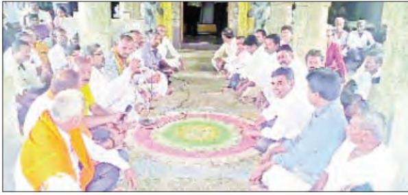
దర్శించుకున్నారు. మండలంలోని పలు గ్రామాలకు చెందిన పెద్ద ఎత్తున ప్రజలు ఉగాది పర్వదిన వేడుకలలో పాల్గొన్నారు.