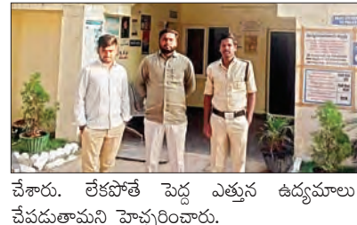
చేశారు. లేకపోతే పెద్ద ఎత్తున ఉద్యమాలు చేపడుతామని హెచ్చరించారు.

మాట్లాడుతూ రాష్ట్ర ప్రభుత్వం విద్యా రంగానికి 7శాతం నిధులు మాత్రమే కేటాయించిందని, విద్యా రంగానికి 30శాతం నిధులు కేటాయించాలని డిమాండ్ చేశారు. అక్రమ అరెస్టులతో ఉద్యమాన్ని ఆపలేరని అన్నారు. కాంగ్రెస్ ప్రభుత్వం విద్యా రంగానికి 30శాతం నిధులు కేటాయించాలని, ఎన్నికల ముందు ఇచ్చి ఆరు గ్యారంటీలను అమలు చేయాలని డిమాండ్