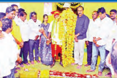
తాజా మాజీ సర్పంచులు ఎంపీటీసీలు నాయకులు తదితరులు పాల్గొన్నారు.