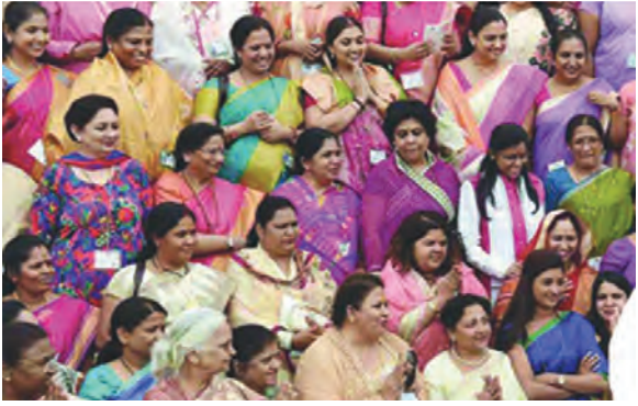
గృహముఖం. ఈ ఒత్తిళ్ల మనసిక ఆలోచనై తీవ్ర ప్రభావం చూపుతాయి. బాధ, ముఖం, ఒత్తిళ్ల వల్ల మహిళల జీవితాలను తీవ్రంగా ప్రభావితం చేస్తున్నాయి.

అంతర్జాతీయ మహిళా దినోత్సవం లోజే ఎక్కువగా లేని ఎవరు ఎవరుగని ఎవరేని ప్రేమలు గుర్తుకు వస్తాయి. ఎక్కడ చూసినా ఫోటోలు, వీడియోలు, కేక్ కలింగ్లు, ఉపన్యాసాలలో హడావిడి చేసే జనం ఇప్పుడు ఈ రోజు నుండి ఒక్కటే పట్టించుకోరు వాళ్ళ కన్నీటి డాబ్బులు ఎవరూ అడగరు. మామూలే అంతా మామూలే ఎక్కడ వేసిన గొంగళి అక్కడే కదా. మరీ ఈ రోజు నుండి స్త్రీ పరిస్థితి ఏంటి? వారు ఎందుకు ఎదగలేక పోతున్నారు! మనదేశం లో 30. స్త్రీలు ఎదగని అందరూ వారి గురించే మాట్లాడుతూనే మిగతా వారి గురించి, వాళ్ళ పరిస్థితి ఎంటి? ఆలోచిద్దామా. అసల సమాజం అభివృద్ధి చెందాలంటే ప్రతి ఒక్కరికీ సమాన అవకాశాలు, హక్కులు మరియు గౌరవం ఉండాలి. అలా నేటి సమాజంలో స్త్రీలు అనేక సమస్యలు ఎదురవుతున్నాయి.