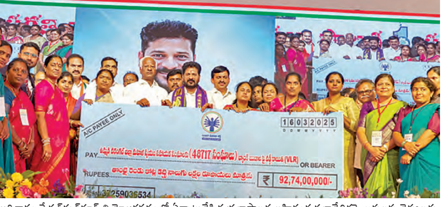
అదివారం స్టేషన్ఘనపూర్ నియోజకవర్గంలో ఏర్పాటుచేసిన ప్రజాపావన బహిరంగ సభావేదికపై అధ్యక్షులకు చెక్కులను

>>> గ్రాండ్ డ్రైనేజీ వంటి మోగా ప్రాజెక్టుల ద్వారా వరంగల్ను హైదరాబాద్కు సమానంగా అభివృద్ధి చేస్తామని తెలిపారు. గత పాలకుల నిర్లక్ష్యాన్ని ఎత్తిమాచిన సీఎం, రాష్ట్రంపై భారీగా పెరిగిన అప్పులను ప్రస్తావించారు.