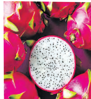
ముదురు గులాబీ రంగులో ఉండే డ్రాగన్ ఫ్రూట్ లోపల వెన్నెల ఉంటుంది. ఇందులో అధికంగా ఉండే విటమిన్ సి మీ రోగనిరోధక శక్తిని పెంచుతుంది. దీన్ని తరచూగా తినడం వల్ల

జలుబు, దగ్గు నుంచి ఉపశమనం పొందవచ్చు. ఇందులోని పోషకాలు రక్తంలో చక్కెర స్థాయిలను అదుపులో ఉంచుతాయి. యాంటీఆక్సిడెంట్లు శరీర కణాలను ప్రీ రాడికల్స్ నుండి రక్షించడంలో సహాయపడతాయి. ఇందులో ఉండే పీచు మన పొట్టలో మంచి బ్యాక్టీరియా పుష్టికి, ఆరోగ్యానికి తోడ్పడుతుంది. ఈ బ్యాక్టీరియా మనల్ని రకరకాల వ్యాధుల నుంచి కాపాడుతుంది. శరీరానికి అవసరమైన ఐరన్, డ్రాగన్ ఫ్రూట్ పుష్కలంగా ఉంటుంది. ఈ వంటలో ఎక్కువగా ఉండే మెగ్నీషియం, క్యాల్షియం ఎముకల ఆరోగ్యాన్ని కాపాడతాయి. మెగ్నీషియం బైవీ2 మధుమేహం మరియు చర్మ ఆరోగ్యం ప్రమాదాన్ని తగ్గించడంలో సహాయపడుతుంది. చర్మం పొడిబారకుండా మృదువుగా ఉండాలంటే ఈ వంటను తరచూగా తినాలి.