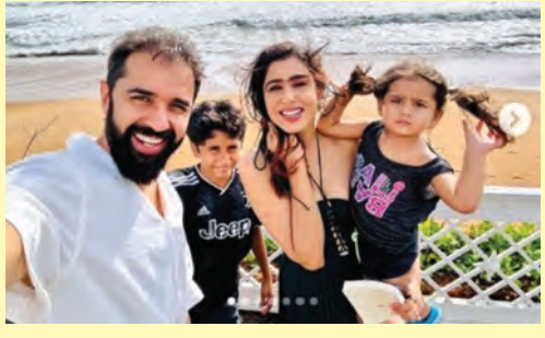
నింపే గజల్.. జేబీవల్ పెట్టిన మరో పోస్ట్ అందరిలో ఆలోచనను రేకెత్తిస్తోంది.

పోతోందామె. అంతేకాదు.. తాను పాటింపే వ్యాపార మెలకువలను, ఇతర బిజినెస్ విద్యాలను తరచూ సోషల్ మీడియాలో పోస్ట్ చేస్తూ బెనెఫిట్ వ్యాపారవేత్తల్లో స్పృహ