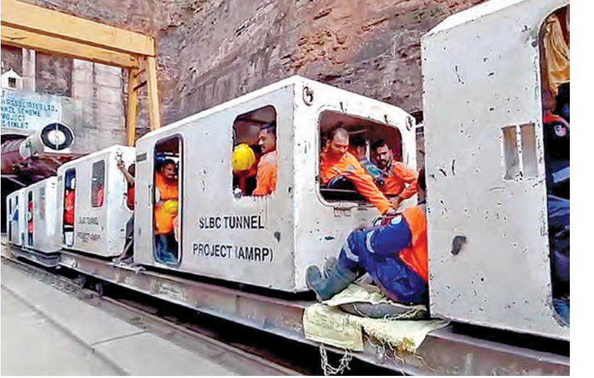
ఎన్.ఎల్.బి.టి టన్నెల్ వద్ద ఆదివారం కొనసాగిన రెన్యూ ఆఫ్ రేవన్ దృశ్యం

>>> అవినీతి, దోపిడీ, నియంతృత్వ ధోరణిపై ప్రజల్లో తీవ్ర వ్యతిరేకత ఉంది. దాని నుంచి తప్పించుకోవడానికి రాజకీయ నాయకులు ఆదేశించి సిద్ధమయ్యారన్నారు.