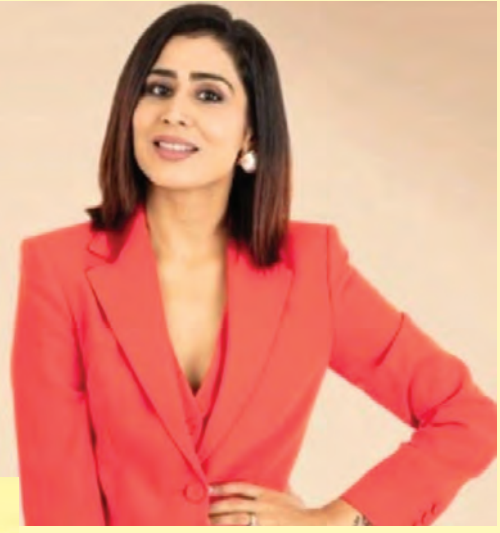
విధానాన్ని గజల్ వివరించింది.

వంట.. నా ఒత్తిడి! ఈ కార్టూన్లో ప్రపంచంలో మనం