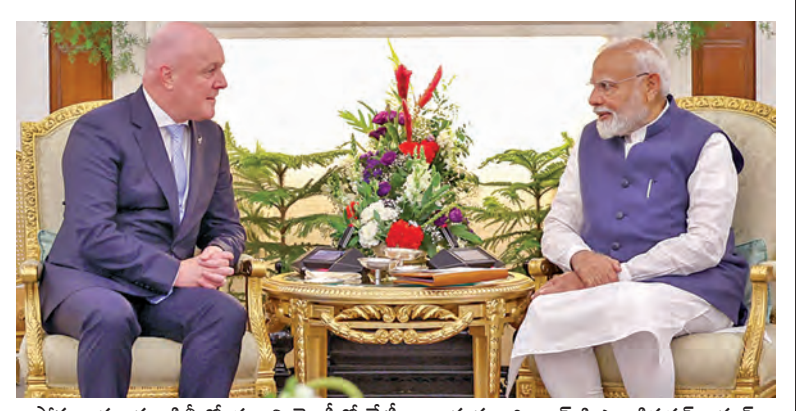
సోమవారం న్యూఢిల్లీలో ప్రధాని మోదీతో భేటీ అయిన న్యూజిలాండ్ పిఎం క్రిస్టోఫర్ లక్సన్

బిల్లులు ఆమోదం పొందిన అనంతరం శాసనసభ మంగళవారానికి వాయిదా పడింది. అంతకు ముందు సిఎం రేవంత్ రెడ్డి సభలో మాట్లాడుతూ సామాజిక, ఆర్థిక, రాజకీయ అంశాలపై కులగణన చేసిన మొదటి ప్రవేశపెట్టిన తీర్మానం కాదని బిల్లు అని స్పష్టం చేశారు. చట్టపరంగా సాధించుకునేందుకు నాయకత్వం వహించేందుకు సిద్ధంగా ఉన్నామని, ఈసారి 4 ఎమ్మెల్యే స్థానాలను ఎస్సీ, ఎస్టీ, టీసీలకే ఇవ్వాలని ఆయన ఆసండ్లీలో గుర్తు చేశారు. 1979లో మండల్ కమిషన్ వేశారని, మండల్ కమిషన్ తోనే టీసీ రిజర్వేషన్లకు చట్టబద్ధత ప్రారంభమైందని సిఎం ఆన్నారు. టీసీ రిజర్వేషన్లు పెంచుతామని కామారెడ్డి డిక్లరేషన్ లో ప్రకటించామని గుర్తు చేశారు. కులగణన, టీసీ రిజర్వేషన్ల అంశాన్ని ఏడాదిలోపు ప్రక్రియను పూర్తి చేశామని తెలిపారు. టీసీ రిజర్వేషన్లు పెంపు అంశంపై మద్దతు ఇస్తున్న అందరికీ సిఎం ధన్యవాదాలు తెలిపారు. కేంద్రం నుంచి అంగీకారం కోసం పోరాడుతానన్న సిఎం రేవంత్ రెడ్డి ప్రధాని మోదీని కలిసేందుకు అన్ని పార్టీల నేతలు ముందుకు రావాలని పిలుపునిచ్చారు. చట్టసభల్లో టీసీలకు రిజర్వేషన్లు కల్పించేలా రాజ్యాంగ సవరణ జరగాలని వెల్లడించారు. అవసరమైన రాజ్యాంగ సవరణ జరిగేలా అందరం కలిసి