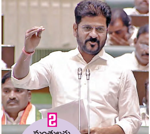
మంత్రులను తొలగిస్తేనే పాలనపై పట్టు ఉన్నట్లా?: సిఎం రేవంత్

ప్రభాతవార్త ప్రధాన ప్రతినిధి, హైదరాబాద్, మార్చి 17: తెలంగాణలో చారిత్రాత్మకమైన బిల్లులు ఆమోదం పొందాయి. టీసీలకు మేలు జరిగే టీసీ రిజర్వేషన్లకు సంబంధించి 2 బిల్లులకు తెలంగాణ శాసనసభ ఆమోదం లభించింది. టీసీలకు 42 శాతం రిజర్వేషన్లు కల్పిస్తూ శాసనసభలో ప్రవేశపెట్టిన బిల్లులను సోమవారం సాయంత్రం శాసనసభ ఆమోదించింది. దీని ద్వారా విద్య, ఉద్యోగాల్లో టీసీలకు 42 శాతం రిజర్వేషన్ కల్పించేందుకు అవకాశం ఉంటుంది. అలాగే, తెలంగాణ రాష్ట్రంలోని స్థానిక సంస్థల్లో టీసీలకు 42 శాతం రిజర్వేషన్ కల్పించే బిల్లును సైతం ఆసండ్లీ ఆమోదం తెలిపింది.