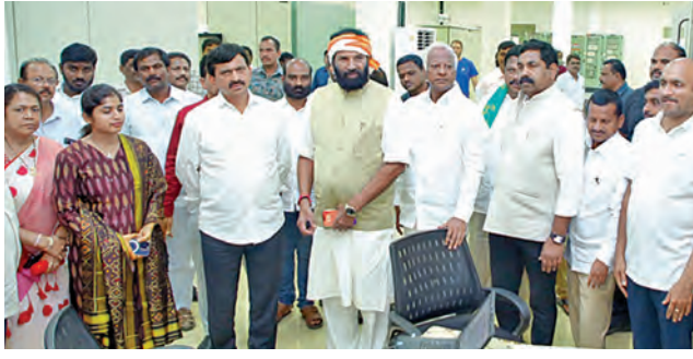
గురువారం దేవాదుల ట్రయల్ రన్ ను ప్రారంభిస్తున్న మంత్రి ఉత్తమ్

దేవన్నపేట పంప్ హౌజ్ నుంచి ధర్మసాగర్ కు గోదావరి జలాల 60 వేల ఎకరాలకు సాగునీరు: మంత్రి ఉత్తమ్