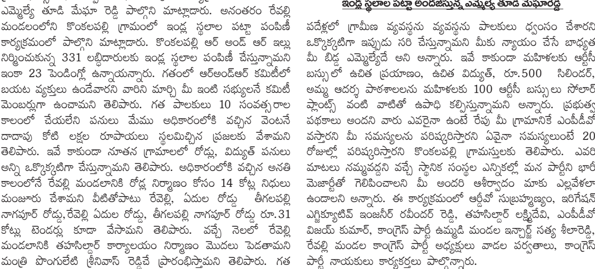
ఇండ్ల స్థలాల పట్లా అందజేస్తున్న ఎమ్మెల్యే తూడి మేఘారెడ్డి

వనపర్తి ప్రతినిధి, మార్చి 20 ప్రభాతవార్త: గత పది సంవత్సరాలలో గ్రామాలను ధ్వంసం చేశారని ఏడుల రిజర్వాయర్ నిర్మాణంలో భూములు, ఇండ్లు కోల్పోయిన కొంతవల్లి, బండరాయిపాకుల నిర్మాణానికి తాను అందగా ఉండి పూర్తిస్థాయిలో న్యాయం చేస్తానని వనపర్తి శాసనసభ్యులు తూడి మేఘారెడ్డి పేర్కొన్నారు. రేపల్లి మండలంలోని బండరాయిపాకుల గ్రామంలో మహిళా లైట్ల ఎమ్మెల్యే తూడి మేఘా రెడ్డి పాల్గొని మాట్లాడారు. అనంతరం రేపల్లి మండలంలోని కొంతవల్లి గ్రామంలో ఇండ్ల స్థలాల పట్లా పంటికి కార్యక్రమంలో పాల్గొని మాట్లాడారు. కొంతవల్లి ఆర్ అండ్ ఆర్ ఇబ్బు నిర్మించుకున్న 331 అద్దెదారులకు ఇండ్ల స్థలాల పంటికి చేస్తున్నామని ఇంకా 23 పెండింగ్ ఉన్నాయన్నారు. గతంలో ఆర్ అండ్ ఆర్ కమిటీలో ఆర్ అండ్ ఆర్ కమిటీ లిటితోవారిని వారిని మార్చి మీ ఇంటి సభ్యులనే కమిటీ మెంబర్లుగా ఉండాలని తెలిపారు. గత పాకులు 10 సంవత్సరాల కాలంలో చేయలేని పనులు మేము అధికారంలోకి వచ్చిన వెంటనే దాచుకుని కోటి లక్షల రూపాయలు స్థలమిచ్చిన ప్రజలకు వేతామని తెలిపారు. కోటి లక్షల రూపాయలను కేంద్రం అందజేస్తే పనులు అన్ని ఒక్కొక్కటిగా చేస్తున్నామని తెలిపారు. అధికారంలోకి వచ్చిన అనతి కాలంలోనే రేపల్లి మండలానికి రోడ్ల నిర్మాణం కోసం 14 కోట్ల నిధులు మంజూరు చేశామని లిటితోవారు రేపల్లి, ఏడుల రోడ్ల తీగలపల్లి నాగపూర్ రోడ్లు, రేపల్లి ఏడుల రోడ్లు, తీగలపల్లి నాగపూర్ రోడ్లు రూ.31 కోట్లు టెండర్లు కూడా వేతామని తెలిపారు. వచ్చే నెలలో రేపల్లి మండలానికి తహసీల్దార్ కార్యాలయం నిర్మాణం మొదలు పెడతామని మంత్రి పొంగరేటి శ్రీనివాస్ రెడ్డి ప్రకటించారు తెలిపారు. గత