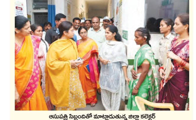
ఆసుపత్రి సిబ్బందితో మాట్లాడుతున్న జిల్లా కలెక్టర్

నారాయణపేట జిల్లా కలెక్టర్ సిక్రా పట్నాయక్