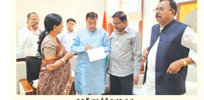
నిజన్ గడ్డకరికి వివేక పత్రం అందజేస్తున్న ఎంపీ డిఈ అరుణ, ఎమ్మెల్యే శ్రీనివాస్ రెడ్డి

కేంద్ర మంత్రిని కలిసిన ఎంపీ డిఈ అరుణ, ఎమ్మెల్యే శ్రీనివాస్ రెడ్డి