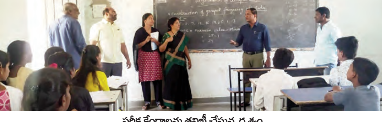
పరీక్ష కేంద్రాలను తనిఖీ చేస్తున్న దృశ్యం