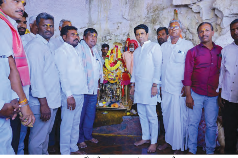
అచ్చంపేట ప్రత్యేక పూజలు నిర్వహిస్తున్న ఎమ్మెల్యే