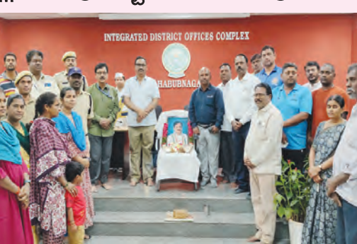
శ్రీపాదరావు చిత్రపటం వద్ద నివాళులర్పిస్తున్న అదనపు కలెక్టర్, జిల్లా అధికారులు