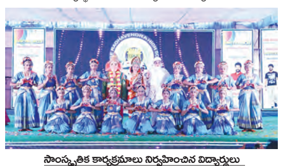
సాంస్కృతిక కార్యక్రమాల నిర్వహించిన విద్యార్థులు