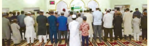
జామ మజిలీ ప్రార్థనలు నిర్వహిస్తున్న ముస్లింలు