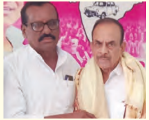
మహిమూద్ అలీకి జన్మదిన శుభాకాంక్షలు తెలుపుతున్న మైసూరీ నాయకుడు

భూత్పూర్, మార్చి 2 ప్రభాతవార్త : తెలంగాణ రాష్ట్ర మాజీ ఉప ముఖ్య మంత్రి మహిమూద్ అలీని ఆయన జన్మినా నాన్ని పురస్కరించు కని అతివిన మైసూరీ నా యకుడు మొహమ్మద్ సా దిక్ ఆదివారం స్వయం గా కలిసి శాలువతో సత్క రించి పుష్పగుచ్ఛాన్ని అం దించి జన్మదిన శుభాకాంక్షలు తెలిపారు.