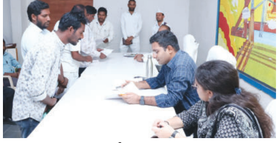
ఫిర్యాదులు స్వీకరిస్తున్న అధికారులు

నారాయణపేట టౌన్, మార్చి 10 ప్రభాతవార్త : ప్రజావాణి కార్యక్రమానికి ప్రాధాన్యతను ప్రజల నుంచి ఫిర్యాదులను సత్కరమే పరిష్కరించాలని కలెక్టర్ సినీత పట్నాయక్ అధికారులకు సూచించారు.