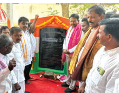
సినీ రోడ్డు, అండర్ గ్రౌండ్ డ్రైనేజీ పనులకు శంకుస్థాపన చేస్తున్న ఎమ్మెల్యే

మహబూబ్ నగర్ బ్యారో, మార్చి 10 ప్రభాతవార్త: పేద ప్రజలకు అండగా ఉంటూ వారి సందేహానికి కట్టు బడి ప్రజాప్రభుత్వం పనిచేస్తుందని మహబూబ్ నగర్ ఎమ్మెల్యే యెన్నెం శ్రీనివాసరెడ్డి అన్నారు.