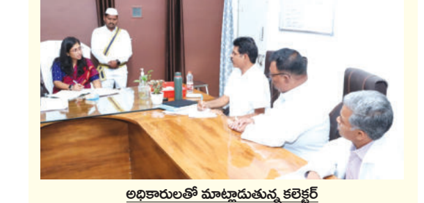
అధికారులతో మాట్లాడుతున్న కలెక్టర్