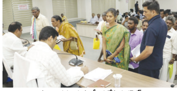
ప్రజల వినతులను పరిశీలన చేస్తున్న కలెక్టర్

గద్వాల, మార్చి 10 ప్రభాతవార్త : ప్రజావాణి కార్యక్రమానికి ప్రాధాన్యతను వచ్చిన ఫిర్యాదులను సత్కరమే పరిష్కరించాలని జిల్లా కలెక్టర్ బి.యం.నందోష్ అధికారులకు సూచించారు.