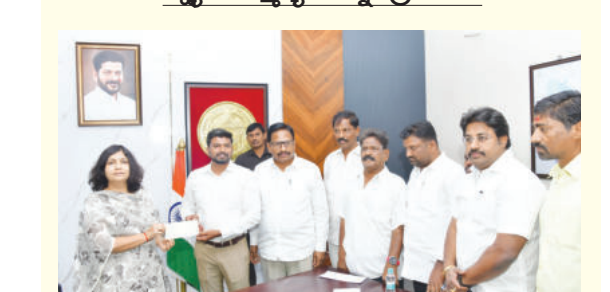
కలెక్టర్ రూ. 10 లక్షల చెక్కు అందజేస్తున్న మై హాంపేల సంస్థ సభ్యులు, చిత్రంలో ఎమ్మెల్యే యెన్నెం

మహబూబ్ నగర్ బ్యారో, మార్చి 10 ప్రభాతవార్త: మహబూబ్ నగర్ విద్యా నిధికి 10 లక్షల రూపాయల భారీ విరాళాన్ని మై హాం గ్రామ్ సంస్థ అధ్యక్షులతో సంస్థ ప్రతినిధి -మంగళం 3ఓ.