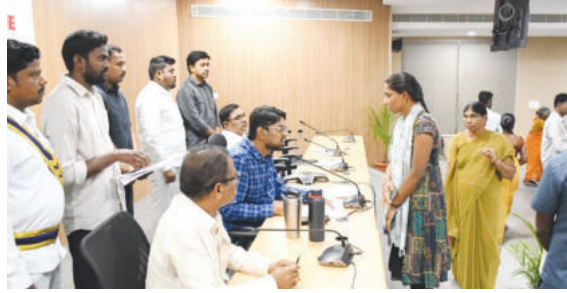
ప్రజావాణిలో ఫిర్యాదుదారులతో మాట్లాడుతున్న జిల్లా కలెక్టర్

వనపర్తి టౌన్, మార్చి 10 ప్రభాతవార్త : ప్రజావాణి కార్యక్రమంలో భాగంగా ప్రజల నుంచి స్వీకరించిన ఫిర్యాదులు, అల్లలను వేగంగా పరిష్కరించాలని జిల్లా కలెక్టర్ ఆదర్శ సురభి ఆదేశించారు.