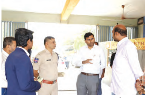
పరీక్ష కేంద్రాలను పరిశీలన చేస్తున్న కలెక్టర్, ఎస్.ఐ.