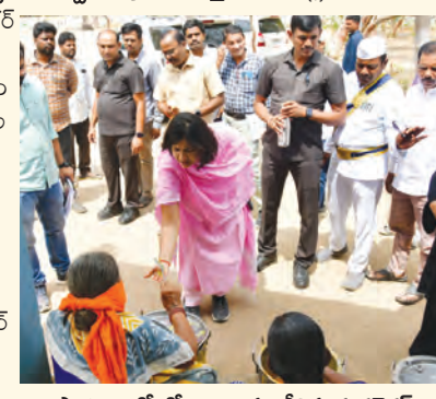
పాఠశాలలో భోజనాన్ని పరిశీలిస్తున్న కలెక్టర్

మహబూబ్ నగర్ బ్యూరో, మార్చి 4 ప్రభాతవార్త : కౌకుంట్ల మండల కేంద్రంలో జిల్లా కలెక్టర్ విజయలక్ష్మి బోయి మంగళవారం పర్యటించి ఎంపిడిఓ కార్యాలయం, జి.పి.ఉన్నత పాఠశాలను తనిఖీ చేశారు.