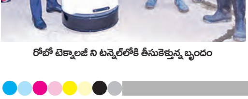
రోజూ టెక్నాలజీని ఉపయోగించి టన్నెల్ లోకి తీసుకెళ్లుతున్న బృందం