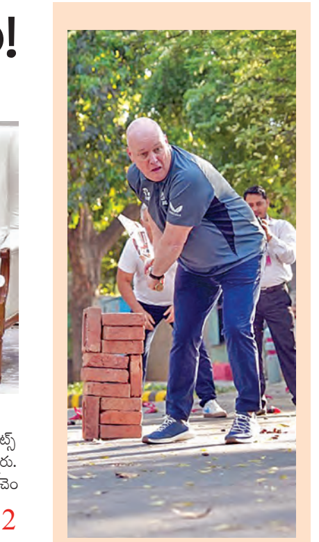
బుధవారం ఢిల్లీలో గట్టి క్రికెట్ ఆడుతున్న న్యూజిలాండ్ ప్రధాని క్రిస్టోఫర్ ఢిల్లీలో న్యూజిలాండ్ పిఎం