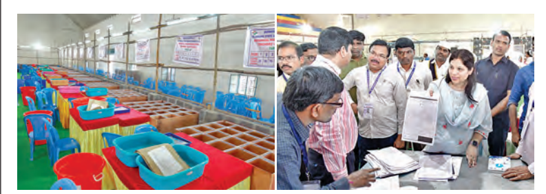
నల్లగొండలో సిద్దమైన కౌంటింగ్ కేంద్రాలు కరీంనగర్లో ఏర్పాటు పర్యవేక్షిస్తున్న అధికారులు

బిఆర్ఎస్, బిజెపి ఒక్కటే.. వాళ్లకు ఆడబట్టలు సలాకితో వాతపట్టాల్సి వనపర్తి సభలో సీఎం రేవంత్ రెడ్డి ఫైర్