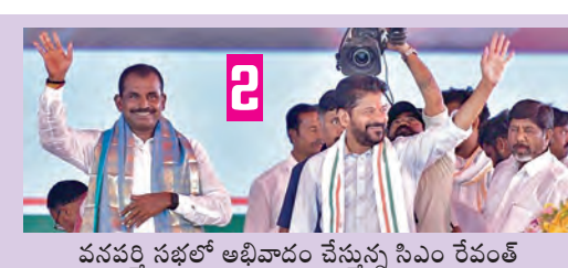
వనపర్తి సభలో అభివాదం చేస్తున్న సీఎం రేవంత్