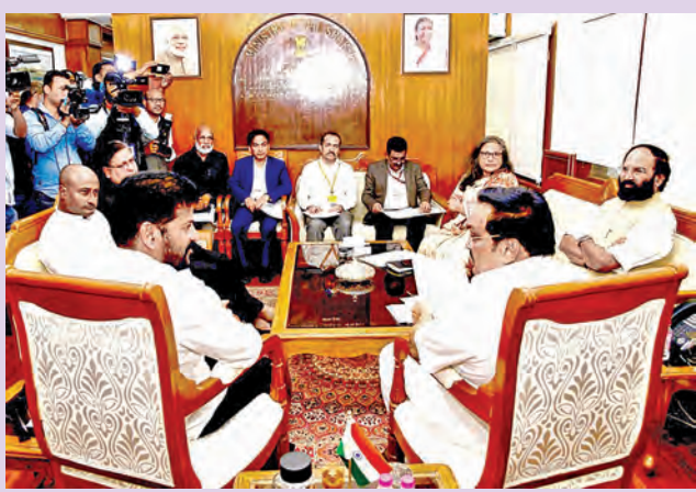
సోమవారం న్యూఢిల్లీలో కేంద్ర జలశక్తి మంత్రి సిఆర్ పాటిల్తో భేటీ అయిన ముఖ్యమంత్రి రేవంత్, మంత్రి ఉత్తమ్ తదితరులు