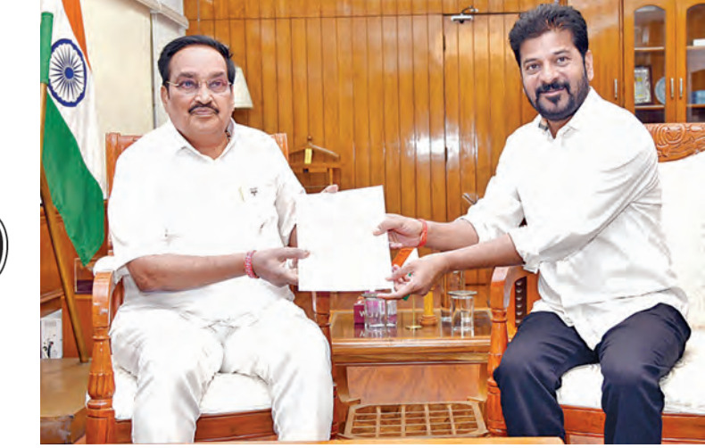
సోమవారం న్యూఢిల్లీలో కేంద్ర జలశక్తి మంత్రి సిఆర్ పాటిల్ కు వివేక వత్తం అంబేద్కర్ ను సీఎం రేవంత్

కేంద్ర జలశక్తి మంత్రి సిఆర్ పాటిల్ ను కోరిన సిఎం రేవంత్, మంత్రి ఉత్తమ్ ఎపి తీసుకునే 10 వేల క్యూసెక్కుల నీటిని సగానికి తగ్గించేందుకు కేంద్రం హామీ ట్రిబ్యునల్ విచారణ త్వరగా పూర్తికి కేంద్రం అంగీకారం టెలిమెట్రీల ఏర్పాటుకు కూడా కేంద్రం సమ్మతి