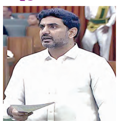
దెవలపే మెంట్ బోర్డులో చర్చలు జరుపుతున్నాయి. యూనివర్సిటీ ఆఫ్ టెక్నాలజీ, ఎంఐ పర్సనల్ ఫిలిప్స్ ఆసక్తి కనబర్చాయి. ఇతర పర్సనల్ ప్రతినిధులు కూడా చర్చలకు వస్తున్నారు. పెద్దపల్లె ప్రైవేటు రంగంలో భారత్లో టాప్ పర్సనల్ కంపెనీగా విదేశీ యూనివర్సిటీలను అడిగి తెచ్చేవిధంగా ప్రోత్సహిస్తాం. కేవలం అమరావతి, విశాఖపట్టణం కాకుండా అన్ని ప్రాంతాలకు తెస్తాం. ఇన్ఫోటెక్నికల్ అడిగింది. ఇన్ఫో టెక్నికల్ అమరావతిలో ఉన్న అనుమతిని తెచ్చి, ప్రత్యేక కేసుగా పరిగణించి ప్రాంతానికి ట్రిపుల్ ఐటీ ఏర్పాటు >>2

యమై నిబంధనలు ఉన్నాయని లోకేశ్ తెలిపారు. ఈ ఊ. ప్రకారం సరిపడనంత అటంకం లేకపోతే మున్సిపల్ గ్రౌండ్స్ తో టైలర్ కాపర్ని అడి కూడా అందుబాటులో లేకపోతే వేరే స్కూల్తో టైలర్ కాపర్ని అన్నారు. ప్రైవేటు స్కూల్ల పర్మిట్ల విషయంలో కొన్ని లోటుపాట్లు ఉన్నట్లు తన దృష్టికి వచ్చాయని ఇందుకు ట్రాన్స్ పరెంట్ మోకానిజం ఏర్పాటు చేయాలని నిర్ణయించామన్నారు. ప్రైవేటు స్కూల్ టీచర్ల జీతాల విషయమై ప్రైవేటు యజమానులతో సమావేశం కాగా, కొన్ని పత్రాలు ఇచ్చేందుకు ప్రైవేటు టీచర్ల నిరాశిస్తున్నట్లు తమ దృష్టికి తెచ్చారన్నారు. వచ్చేవారం ప్రైవేటు టీచర్లతో సమావేశమై వారి సమస్యలు తెలుసుకున్నట్లు మంత్రి లోకేశ్ చెప్పారు. పలు ప్రైవేటు పర్సనల్ ఏకనమిక