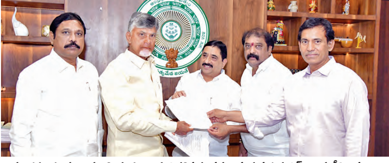
మంగళవారం ముఖ్యమంత్రి చంద్రబాబుకు విసతిపత్రం సమర్పిస్తున్న ప్రభుత్వ విప్ కాలవ శ్రీనివాసులు, ఎమ్మెల్యే గుమ్మనూరు జయరాం, పార్లమెంటు, ఎమ్మెల్యే జి.బి.నారాయణ