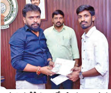
జహ్ను తండ్రికి రూ.50వేల సాయం అందిస్తున్న మంత్రి వాసంశెట్టి సుభాష్

విజయవాడ మార్చి 18 ప్రభాతవార్త: ఆపదలో ఉన్నవారు ఎవరైనా సరే వారిని ఆదుకోని