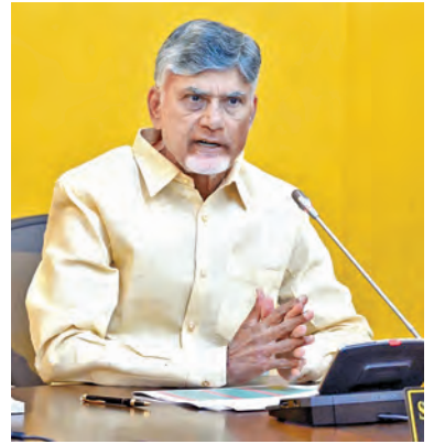
విజయవాడ, మార్చి 18, ప్రభాతవార్ ప్రతినిధి: రాష్ట్రంలో నియోజకవర్గాలన్నింటిలోనూ ప్రతి కుటుంబానికి ఇంటి స్థలం ఉండాలన్నదే ప్రభుత్వ ఆశయమని సీఎం చంద్రబాబునాయుడు స్పష్టం చేశారు. గ్రామీణ ప్రాంతాల్లో 3 సెంటు, పట్టణ ప్రాంతాల్లో 2 సెంటు ఇస్తాం. గత ప్రభుత్వం సొంబు పట్టణ ఉనికి దూరంగా ఇచ్చింది. దాంతో అవి ఎవరికీ వసతికావడం, చాలాచాలనట్లుగా ఉండటంతో నిరుపయోగం అయ్యాయి. సెంటు పట్టణ ఉన్నచోటే స్థలం కావాలంటే రెండు సెంటు

గ్రామీణ ప్రాంతాల్లో 3 సెంటు, పట్టణ ప్రాంతాల్లో 2 సెంటు ఇస్తాం 26 జిల్లాల అభివృద్ధికి ప్రత్యేక వ్యూహాలు అన్ని ప్రభుత్వ కార్యాలయాలు, ఆలయాల్లో సౌర విద్యుత్ ఫలకాలు - మీడియాతో సిఎం చంద్రబాబు నాయుడు