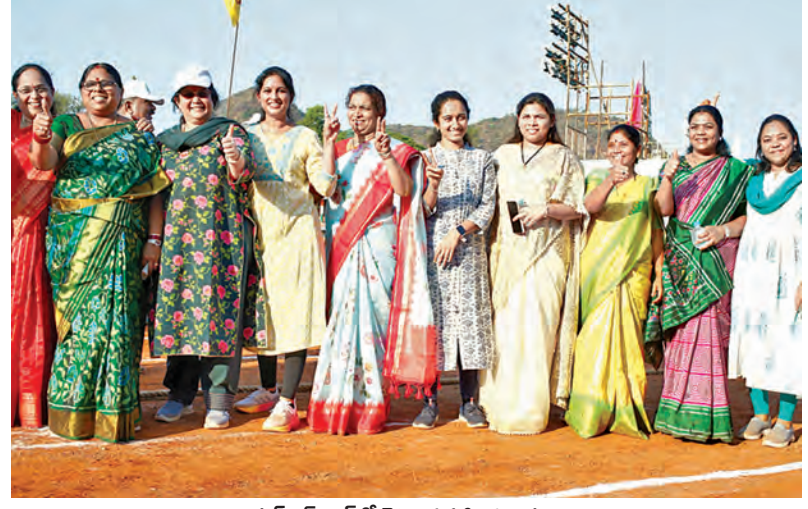
టగ్ ఆఫ్ వార్లో గెలిచిన మహిళల జట్టు