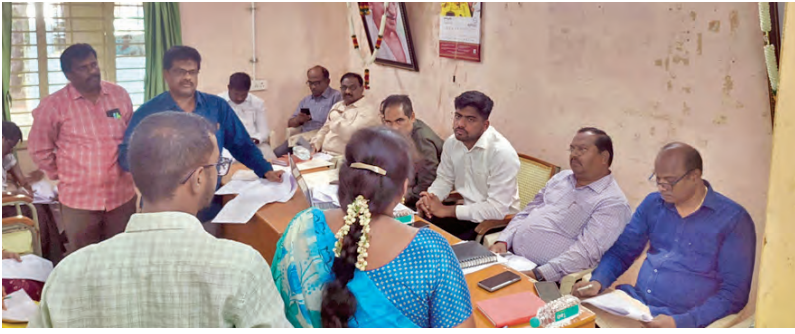
సర్వేయ్య, రీసర్వే డిటిలు, తహశీల్దార్లు, సచివాలయ సర్వేయ్యులు సూచనలను అర్థం చేసుకోవడం

సరిపోదు పరిపాలనలో అందరిలోనూ పరిష్కారం రావాలి! మనం స్వామి దయతో బతుకు తున్నాము. ఆయన దర్శనానికి వచ్చే భక్తుల్ని మనం భగవంతులగా చూడాలన్నారు. అలాకాకుండా వ్యవహారాన్ని కఠిన చర్యలు ఉంటాయని సూచించారు. వేసవిలో సకల సదుపాయాలు: క్యూలైన్లలో భక్తులకు ఇబ్బంది లేకుండా చర్యలు తీసుకోవాలని సూచించారు. ముఖ్యంగా క్యూలైన్లలో ప్రవేశించిన తరువాత కనీసం ఒక గంట పాటు అయినా ఉండాలి వస్తుంది. కాబట్టి వారికి వల్లడి గాలికి ఫ్యాన్లు ఏర్పాటు చేయాలని అలాగే మంచినీటి సదుపాయాలు చల్లబెట్టి నీటి కోసం కూలర్లు ఏర్పాటు చేయాలని ఇంజనీరింగ్ అధికారులకు ఆదేశించారు. ఇక అంతరాలయాలికి వచ్చే ఆతిథ్యం లను ఎక్కడో సమయం నలవకూడదు. పేరు, సంకల్పం అంటూ నిలబెట్టవద్దు. ఎవరైనా సరే ఒకే ఒక నిమిషం మాత్రమే లోపల ఉండాలని ఇబి ఆదేశించారు. లోపలకు వచ్చిన వారితో ఇబ్బంది బయటకువచ్చాలని సూచించారు. ఇక అంతర్గత బదిలీలకు కసరత్తు చేస్తున్నట్లు సమాచారం.