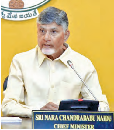
విజయవాడ మార్చి 24 ప్రభాతవార్త ప్రతినిధి: రాష్ట్రంలో ఏ ప్రాంతంలోనూ తాగునీటి ఎద్దడి తలెత్తకుండా చర్యలు తీసుకోవాలని ముఖ్యమంత్రి

ముందస్తు జాగ్రత్తలతో వడదెబ్బ మరణాలు నివారించాలి పాఠశాలల్లో వాటర్ బెల్ట్ విధానం వేసవి ప్రణాళికపై సిఎం చంద్రబాబు