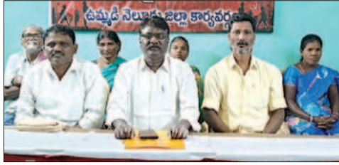
కులు, కౌలు రైతులు, కూలీలు హాజరై జయప్రదం చేయాలని ఆయన సూచించారు.