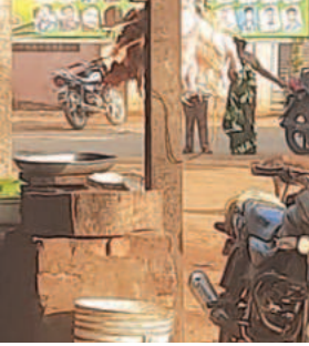
చికెన్ కొనుగోలు చేసే వారు లేక దుకాణాలు వెల వెలబోతున్నాయి.

దగదర్తి, మార్చి 9, ప్రభాతవార్త దగదర్తి మండల ప్రాంతమైన దగదర్తి గ్రామంలో చికెన్ కొనుగోలు చేసే వారు లేక దుకాణాలు వెల వెలబోతున్నాయి.