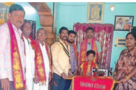
బుచ్చి డ్రెసింగ్ మార్కెట్లో రవివారం నేతృత్వంలో నిర్వహించారు.

బుచ్చి మార్చి 9 ప్రభాతవార్త బుచ్చిరెడ్డిపాళెం వాసివీక్షణ్ నేతృత్వంలో మహిళలకు కుట్టు మిషన్ల పంపిణీ చేశారుకళ్యాణ్ క్రమం వాసివీక్షణ్ బుచ్చి డ్రెసింగ్ మార్కెట్లో రవివారం నేతృత్వంలో నిర్వహించారు.