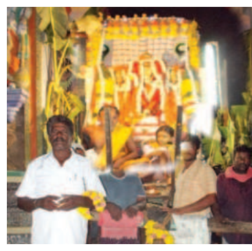
చివర వైభవంగా శేషవాహనోత్సవం

బుచ్చి మార్చి 9 ప్రభాతవార్త బుచ్చిరెడ్డిపాళెం మండలంలోని పంచేడు గ్రామంలో జరుగుతున్న బ్రహ్మోత్సవాలలో భాగంగా శేషవాహనోత్సవం అత్యంత వైభవంగా నిర్వహించారు.