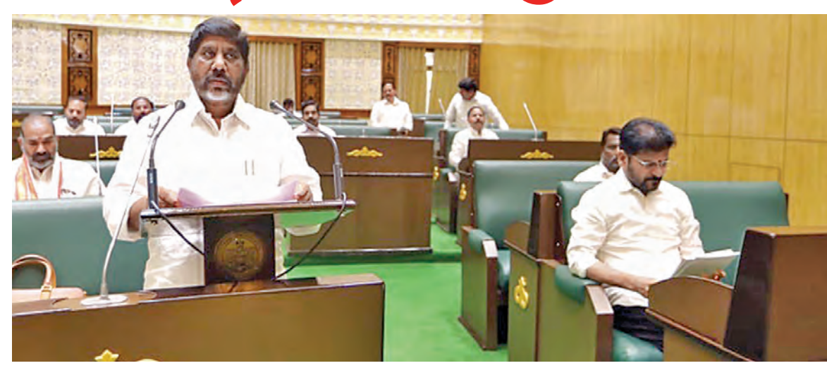
బుద్ధవారం అసెంబ్లీలో బడ్జెట్ను ప్రవేశపెడుతున్న డి.సిఎం భట్టి. చిత్రంలో సిఎం రేపంత్, తదితర ఎమ్మెల్యేలు

>> భట్టివిక్రమార్కు హెచ్చరిస్తూనే రాజీయే పడేక్షలలో వెయ్యి బిలియన్ల డాలర్ల వ్యవస్థగా రూపాంతరం చెందే దిశగా కార్యచరణ ఉంటుందని అభిప్రాయం వ్యక్తంచేశారు. ప్రస్తుతం తెలంగాణ ఆర్థిక వ్యవస్థ పరిమాణం 200 బిలియన్ల డాలర్లు ఉందని ముఖ్యమంత్రి రేపంత్రెడ్డి నాయకత్వంలో "తెలంగాణ రైజింగ్-2050" అనే ప్రణాళికతో ఐదురెట్లు అభివృద్ధి చేసి 100 బిలియన్ల డాలర్ల వ్యవస్థగా రూపొందించామని తెలిపారు. తెలంగాణ స్కూల రాష్ట్ర ఉత్పత్తి రూ. 16,12,579కోట్లు ఉందని, గత సంవత్సరంలో పోల్చితే 10.1శాతం వృద్ధిరేటు ఉందని చెప్పారు. దేశ స్కూల ఉత్పత్తి రూ. 3,31,03,215కోట్లు ఉందనిఅన్నారు. గత ఏడాది జిడిపి వృద్ధిరేటుతో పోల్చితే 9.9శాతం ఉందని వివరించారు. దేశ తలసరి ఆదాయం కంటే తెలంగాణ తలసరి ఆదాయం 1.8రెట్లు అధికమని, రాష్ట్ర తలసరి ఆదాయం రూ.3,79,751 ఉండగా దేశ తలసరి ఆదాయం రూ.2,05,579కోట్లు అని సభకు ఆర్థికమంత్రి గవాలాలో పోల్చిచూపారు.ఒక నిరుపేద తనతోజూరి జీవితంలో ఏ కనీస సదుపాయాలు ఉండాలని కోరుకుంటాలో వాటినిన్నీ అభ్యయ హస్తంలో చేర్చి అమలు చేయగా రూ.5,006 కోట్లు కేవలం ఉచిత ప్రయోజనం ద్వారా మహిళలు అదా చేసుకున్నారుని వివరించారు. ఉచిత బస్సు సౌకర్యంతో ఆర్డీసీ అత్యుపెన్సీ రేషిమెంట్ 94 శాతానికి పెరిగింది. రూ.500కు గ్యాస్ సిలిండర్ పథకం ద్వారా 43 లక్షల కుటుంబాలకు