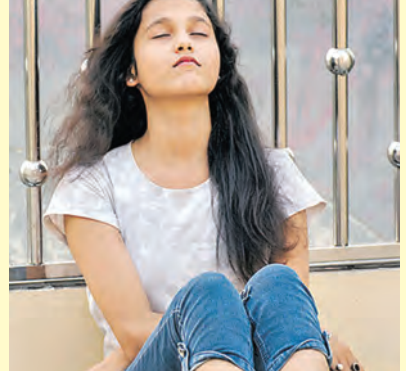
జనాబ: అమ్మ, మీ మానసిక సంఘర్షణ అర్థం అయింది. నిజానికి మీది ప్రేమ అనడం కంటే తెలిసి తెలియని పయనులో కలిగిన వ్యామోహం అనవచ్చు. నిజమైన ప్రేమ అయినప్పటికీ గంజాయి వ్యవసానికి అలవాటు వడి, అక్రమంగా గంజాయి అమ్ముతున్న వ్యక్తిని పెళ్లి చేసుకోవడం మార్గత్యం. ప్రేమించిన వ్యక్తిని పెళ్లిచేతే జీవితం సుఖంగా సాగినా ఉంటుంది భావిస్తారు. అయితే వ్యవసాయం, అసామిక్ కార్యకలాపాలు మానీ వ్యక్తిని పెళ్లిచేతే జీవితం నరక ప్రాయం అవుతుంది. ఆనందంలో సందేహం లేదు. గంజాయి బానిసల పరిస్థితి సైకోసిస్ రుగ్మితో బాధపడే వారిలా ఉంటుంది. గంజాయి దొంగలబందీ వికంగా ప్రవర్తించారు. ఎంతటి నేరమైనా చేయడానికి ఎంతైనా దిగజారడానికి సిద్ధం అవుతారు. మాటివ్యాసం, ఒట్టుపెట్టాను అంటున్న మీరు, మీ కోసం వ్యవసాన్ని మానేసి, అక్రమాలకు స్వేచ్ఛ చెప్పమని అడగండి. అతనిలో మార్పు వస్తుందేమో పరిశీలించండి. మిమ్మల్ని పడుతుంటాడేమో కాని వ్యవసాన్ని ఒడులుకోవండి. ఒక వేళ దీని అడ్డవై విడిచి వేసి మానివేయాలి మాత్రంగా బాగుంటుంది చెప్పలేము. కాబట్టి ఉపాధి మాని వ్యాపారం ఆలోచించండి. మీ అమ్మ బాధన ప్రేమను అర్థం చేసుకోండి అతనిని మరచిపోయి చదువు పూర్తిచేయడానికి ప్రయత్నం చేయండి. మీ కష్టం మీరు నిలబడి తగిన వ్యక్తిని పెళ్లి చేసుకోండి. వ్యవసాయం మానేసి పెళ్లి నరక ప్రాయం అని గుర్తించండి. □

ప్రభుత్వ ఉద్యోగం చేస్తున్న పుట్టి అతనికి ఉన్న తాగుడు వ్యవసాయం వల్ల తాను నరకం అనుభవిస్తున్నాని చెప్పింది. చాలా సార్లు అతను తన వ్యవసాయం ప్రయత్నించానని, అయితే నా కోసమే బలవంతం చేశారు కనిపిస్తున్నది. ఇప్పుడు నేను మానసిక సంఘర్షణకు గురవుతున్నాను. ప్రేమించిన వ్యక్తికి వ్యవసాయం ఉన్నత మాత్రా వదిలిపెట్టాలని ఆయనకు నేను ఇచ్చిన మాట వేసిన ఒట్టు మరచాలా? లేక తల్లి మాట వినాలా అర్థం కాకుండా ఉంది. ఈ దశలో నాకు పరిష్కార మార్గం చెప్పండి.