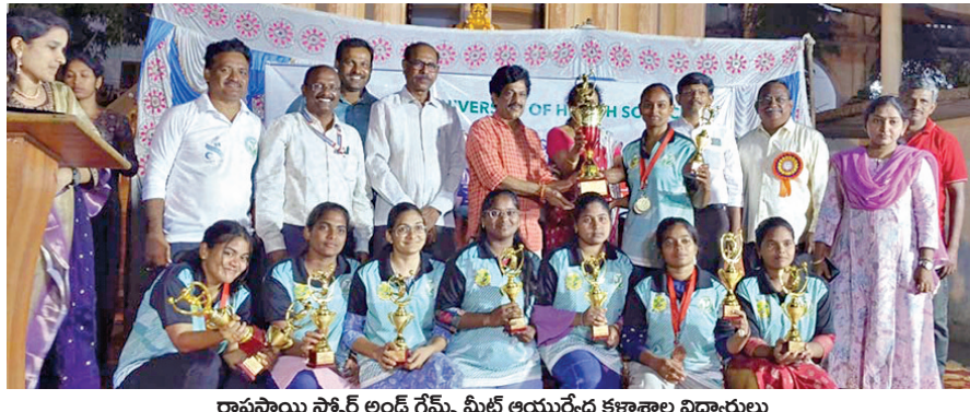
రాష్ట్రస్థాయి స్కాట్ లండ్ గేమ్స్ మీట్ ఆయుర్వేద కళాశాల విద్యార్థులు