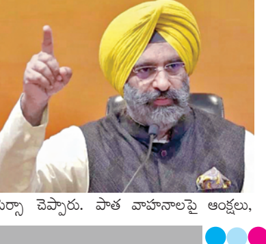
నిర్మాణం చేస్తారు. పాత వాహనాలపై ఆక్షేపణ,

న్యూఢిల్లీ, మార్చి 1: దేశ రాజధానిలో కాలవస్తు నివారణకు ఢిల్లీ బిజెపి సర్కారు కీలక నిర్ణయాలను తీసుకుంది. 15 సంవత్సరాల పైబడిన వాహనాలకు మార్చి 31వ తేదీ తర్వాత పెట్రోల్ బంకుల్లో ఇంధనం పోయడం నిలిపివేయాలని నిర్ణయించింది. కాలవస్తు కట్టడి చర్యల్లో భాగంగా అధికారులతో పర్యావరణ శాఖ మంత్రి మంజుందార్ సింగ్ సిర్కారు శనివారం సమీక్షా సమావేశం నిర్వహించారు. వాహన కాలవస్తు నివారణకు కఠిన చర్యలు తీసుకోవాలని తమ ప్రభుత్వం నిర్ణయించినట్లు మీడియాతో మాట్లాడుతూ