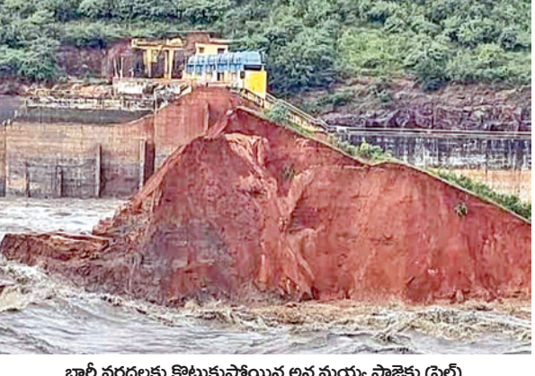
భారీ పరదలకు కొట్టుకుపోయిన అన్నమయ్య ప్రాజెక్టు (ఫైల్)

బడ్జెట్ లో ఏదీ కేటాయింపులు? ప్రాజెక్టు కొట్టుకుపోయి మూడు సంవత్సరాలవుతున్నా ఏదీ పురోగతి! ప్రారంభించేందుకు జగన్ సర్కార్ లో జరిపిన సంప్రదింపులు సఫలం కాకపోవడంతో పనులు ప్రారంభించే పనులు ఎక్కడా లేవ. ఫలితంగా ప్రాజెక్టు కొట్టుకుపోయి మూడు సంవత్సరాలు కావచ్చున్న ఎక్కడ వేసిన గొంగళి అక్కడే అన్నట్లు మారింది. బెండవల ప్రత్యేక తర్వాత ఎక్కడ డ్యాం కొట్టుకుపోయిన నేపథ్యంలో కాంట్రాక్ డ్యాం నిర్మించాలని ప్రతిపాదించారు. ఆయితే తెలంగాణలో మేడిగడ్డ ప్రాజెక్టు కుంగిపోయిన నేపథ్యంలో కేంద్ర జలసంఘం అన్నమయ్య ప్రాజెక్టు కాంట్రాక్ డ్యాం నిర్మాణంపై కూడ సంవేషాలు వ్యక్తం చేసింది. ఎందుకంటే అన్నమయ్య ప్రాజెక్టు చెయ్యరు నదిపై నిర్మించినా ఉన్నాయి. చెయ్యరు నదిలో ప్రస్తుతం స్పిల్ వే ఎక్కడ ఉన్న వోట సారంగాలు పెద్దపట్టు ఉన్నాయి. నాడు అన్నమయ్య ప్రాజెక్టు నిర్మాణంలో కూడ డ్రీల్లింగ్ గ్రౌటింగ్ పద్ధతులతో సారంగాలలోకి లీక్స్ సిమెంటు వండల టన్నులు పంపిన తర్వాత ఇక జబ్బుంది లేదని ఎక్కడోను నిర్మించారు. అలాంటి సారంగాలు ఉన్న నది గట్టులో ఎక్కడ స్పాల్ లో పుర్తిగా >>2