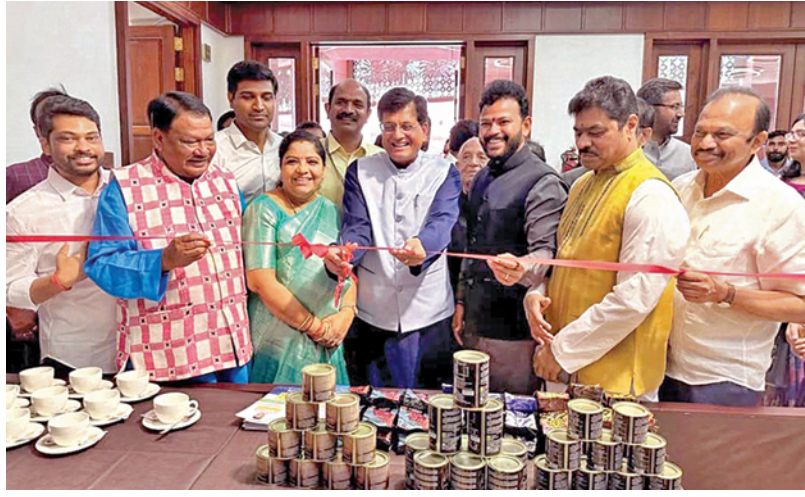
సోమవారం పార్లమెంటు ప్రాంగణంలో అరకు కాఫీ స్టాల్స్ ప్రారంభాన్ని కేంద్రమంత్రిలు రామోహన్, పీయూఐ, ఓరమ్, రిజాజ్