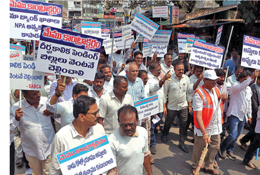
బిజయనగరం రోడ్డును ఊరట నిరసన వ్యక్తం చేస్తున్న కాంట్రాక్టర్లు