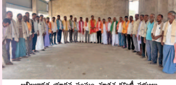
అఖిలభారత యాదవ సంఘం నూతన కమిటీ సభ్యులు