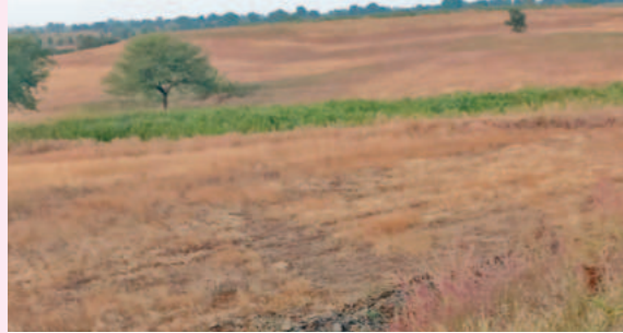
అనుపూ గాన ప్రభుత్వ భూమి