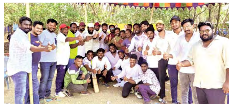
నక్కపల్లి, మార్చి 22, ప్రభాతవార్త

రాష్ట్ర హోం మంత్రి వంగలపూడి అనిత పుట్టినరోజు సందర్భంగా జరుగుతున్న మెగా క్రికెట్ టోర్నమెంట్లో పది రోజులుగా 48 జట్లు పోటీపోటీగా పోటీపడ్డాయి. పాఠశాలస్థాయి నుంచి రాజకార్యాలయ ప్రతి గ్రామం నుండి సుమారు 750 మంది క్రీడాకారులు ఈ టోర్నమెంట్ లో పాల్గొన్నారు. శనివారం సెమీ ఫైనల్ లో యస్. రాయవరం యంగ్ స్టార్స్ వర్సెస్ రాజయ్యపేట నూతన డీమ్, పాఠశాలస్థాయి క్రీకెట్ లవర్స్ వర్సెస్ కోటఉర్రపల్లి జట్టు మధ్య హోం మంత్రి హాజరయ్యారు. పాఠశాలస్థాయి క్రీకెట్ లవర్స్, రాజయ్యపేట నూతన డీమ్ పైనల్ కు చేరుకున్నాయి. ఆదివారం మధ్యాహ్నం 2 గంటలకు హెటికో క్రీడా మైదానంలో పైనల్ మ్యాచ్ జరగనుంది. రాష్ట్ర హోం మంత్రి వంగలపూడి అనిత పైనల్ మ్యాచ్ వీక్షించనున్నారు. పైనల్ కు చేరుకున్న జట్టుకు నేతలు అభినందనలు తెలియజేశారు.