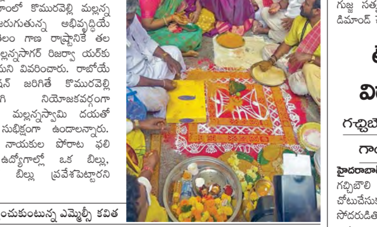
కార్యక్రమంలో బిసెమ్మల ముఖ్యమంత్రి కవిత

హైదరాబాద్, మార్చి 22. ప్రభుత్వం రాష్ట్ర ప్రభుత్వం కేవలం చట్టబద్ధంగా బిసి బిల్లు ప్రవేశ పెట్టడం కాకుండా కార్యక్రమాలలోని ఏదైనా అక్రమములను తనివేయాలి.