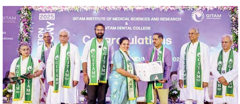
విశాఖపట్నం, మార్చి 22, ప్రభాతవార్త