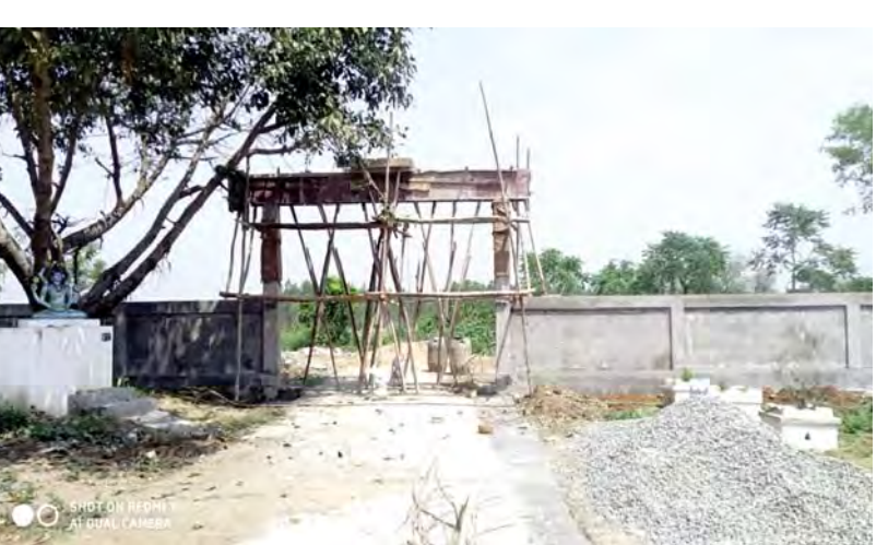
పద్మనాభం, మార్చి 6, ప్రభాతవార్త