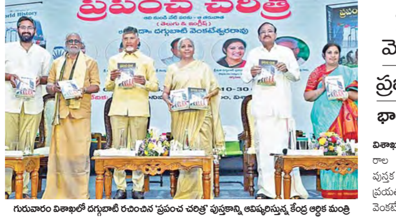
గురువారం విశాఖలో దగ్గరలో రచించిన 'ప్రపంచ చరిత్ర' పుస్తకాన్ని ఆవిష్కరిస్తున్న కేంద్ర ఆర్థిక మంత్రి సీతారామన్, సీని చంద్రబాబు, మాజీ ఉపరాష్ట్రపతి వెంకయ్యనాయుడు, పురంధేశ్వరి తదితరులు

నా తోడల్లుడు అద్భుతమైన పుస్తకం రాశారు.. వెంకయ్య నాయుడులో పవర్ పంచలు తగ్గలేదు ప్రజలు మెచ్చిన ఆర్థిక మంత్రి నిర్మలా సీతారామన్ భారీలక్ష్యాలతో రాష్ట్ర భవిష్యత్ మార్చాలన్నది నా కల: సీని చంద్రబాబు