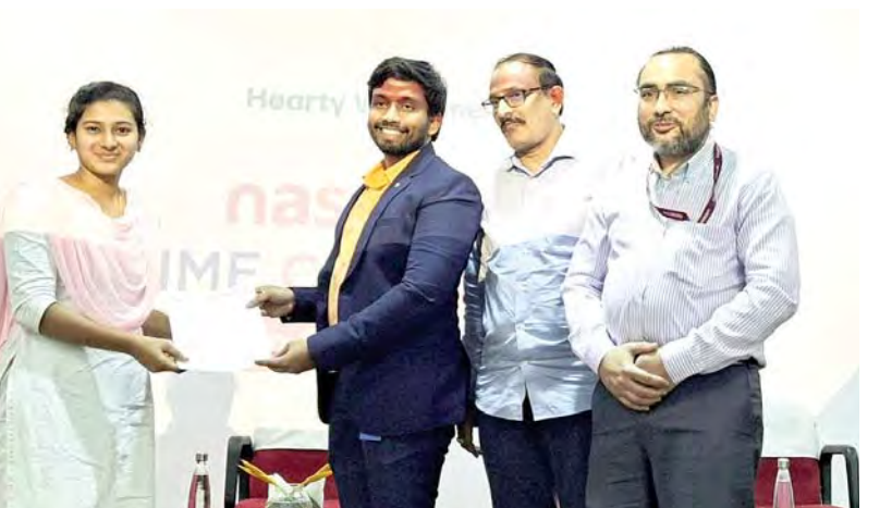
విశాఖపట్నం, మార్చి 6, ప్రభాతవార్త