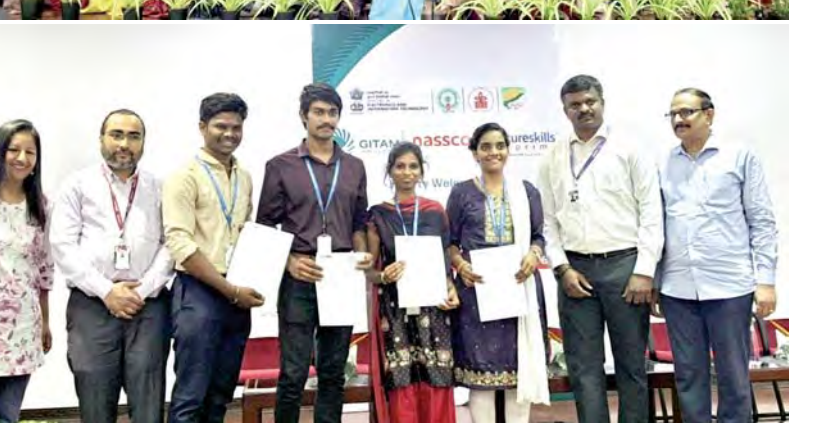
విశాఖపట్నం, మార్చి 6, ప్రభాతవార్త