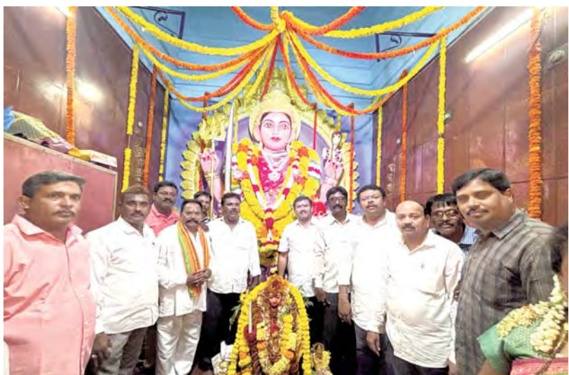
అగనంపూడి, మార్చి 18, ప్రభాతవార్త

అగనంపూడి నిర్వాసితు గ్రామం పెద్దపడక గ్రామ అంబాదేవత పైడితల్లి అమ్మవారి పండుగ ఘనంగా నిర్వహించారు. ఉదయం నుండి మహిళల ఆధిక్యంలో పాల్గొని అమ్మవారికి పసుపు కుంకాల సమర్పించారు. సాయంత్రం పలు సంస్కృతి కార్యక్రమాల నిర్వహించారు. స్థానిక కార్పొరేటర్లు, పెద్దలు అమ్మవారిని దర్శించుకుని ప్రత్యేక పూజలు నిర్వహించారు. భక్తులకు అన్ని సౌకర్యాలను కమిటీ ప్రతినిధులు కల్పించారు.