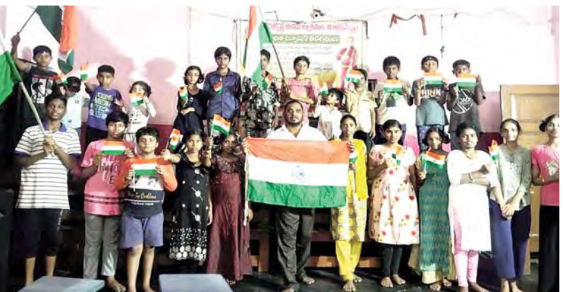
జగదాలం, మార్చి 18, ప్రభాతవార్త