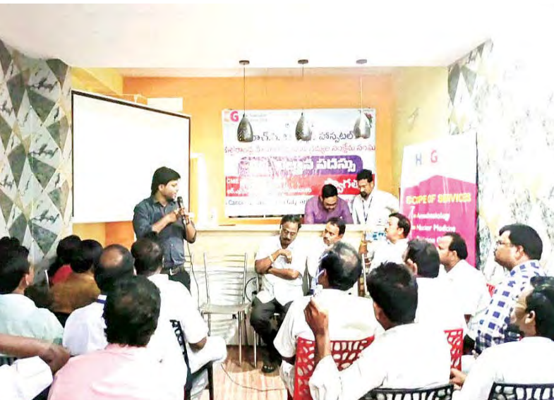
అనంతపురం, మార్చి 18, ప్రభాతవార్త