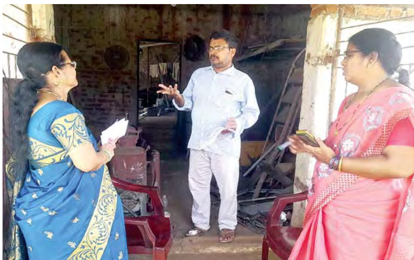
మాకవరపాపం, మార్చి 18, ప్రభాతవార్త