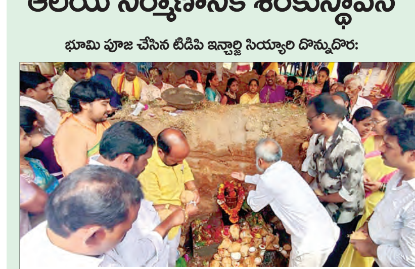
పాడేరు, మార్చి 2, ప్రభాతవార్త:

భూమి పూజ చేసిన టీడిపి ఇన్చార్జి సయ్యాల దొన్నదొర: