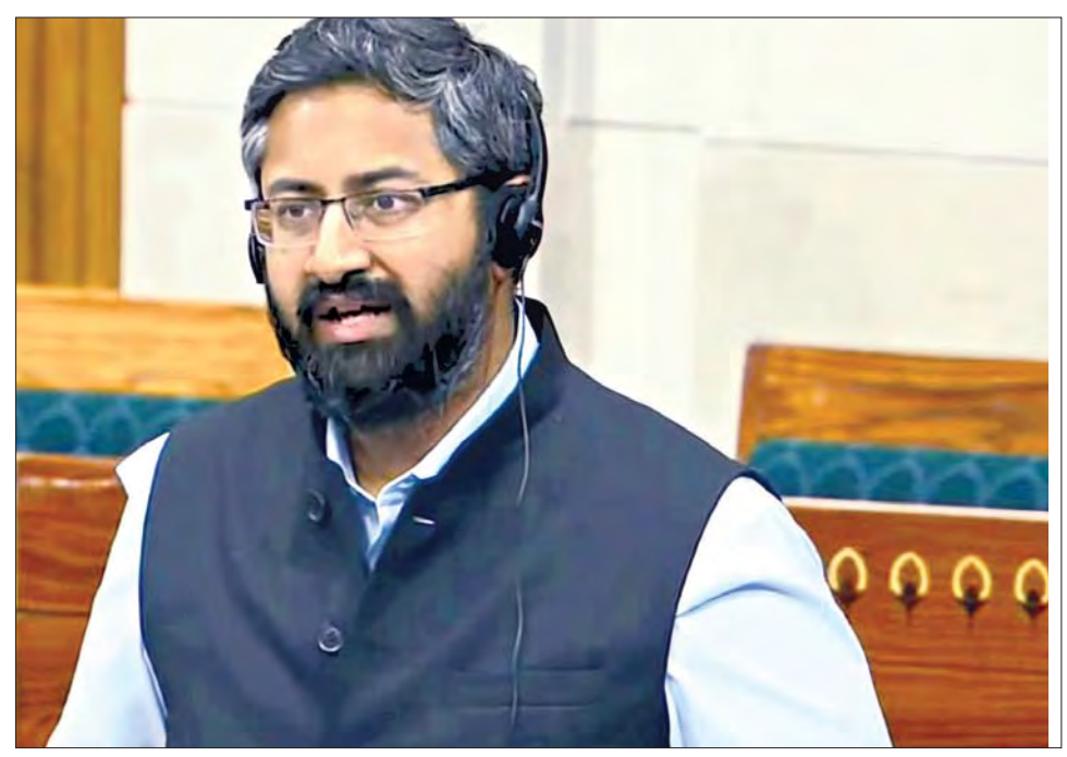
విశాఖపట్నం మార్చి 10, ప్రభాకర్ వారు:

దేశ సముద్ర వాణిజ్య రంగం బలోపేతానికి అవసరమైన మార్పులకు పునరుద్ధరణగా, విశాఖపట్నం ఎంపీ శ్రీభరత్ ప్రార్థనలలో "బిల్డ్ ఆఫ్ లేడింగ్ బిల్లు, 2024" గురించి ప్రస్తావించారు. మారుతున్న అంతర్జాతీయ వాణిజ్య పరిస్థితులకు తగిన పటిష్టమైన చట్టపరమైన ఆధారం అందించడంలో ఈ బిల్లు కీలకమని ఆయన పేర్కొన్నారు. ప్రధాన నౌకాశ్రయాల్లో సరకు రవాణా సామర్థ్యాన్ని రెట్టింపు చేయడం, ప్రపంచంలో టాప్ 100 పోర్టుల్లో తొమ్మిది భారతీయ పోర్టులు చోటు