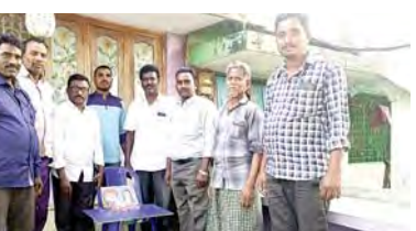
రేగిడి, మార్చి 10 ప్రభాతవార్త

నవ సమాజ నిర్మాణానికి, నవ సమాజ స్థాపనకు సావిత్రిభాయి పూలే ఎంతగానో కృషి చేశారని దళిత, బహుజన జేపీసీ నేతలు కొని యరారు.