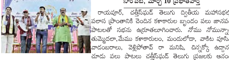
సోంపేట, మార్చి 10 ప్రభాతవార్త

రామపూర్, చత్రీస్ ఫుడ్ తెలుగు ద్వితీయ మహాసభల్లో పదాం ప్రాంతానికి చెందిన కళాకారుల బృందం పలు జానపద పాటలతో సభను ఆకట్టుకున్నారు.