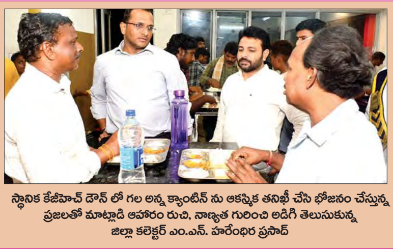
స్థానిక కేజీహెచ్ డౌన్ లో గల అన్న క్యాంపిన్ ను ఆకస్మిక తనిఖీ చేసి భోజనం చేస్తున్న ప్రజలతో మాట్లాడి ఆహారం రుచి, నాణ్యత గురించి అడిగి తెలుసుకున్న జిల్లా కలెక్టర్ ఎం.ఎన్. హరేంద్ర ప్రసాద్