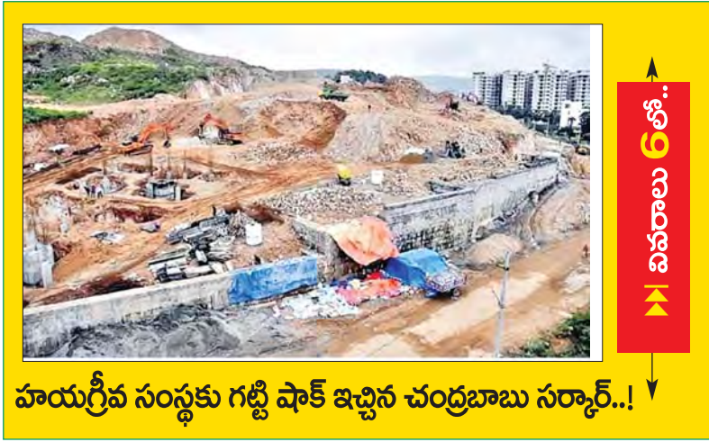
హయగ్రీవ సంస్థకు గట్టి పాకే ఇచ్చిన చంద్రబాబు సర్కార్..!