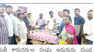
సంబోమ్మల, మార్చి 10 ప్రభాతవార్త

గ్రామ పంచాయతీ కార్యదర్శుల విధుల్లో పనిభారం ఎక్కువగా ఉందని పనిభారం తగ్గించాలని మండల పంచాయతీ కార్యదర్శులు డిమాండ్ చేశారు.