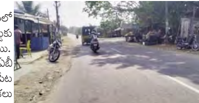
ఆముదాలవలస, మార్చి 10 ప్రభాతవార్త

ఆముదాలవలస పట్టణానికి కిలోమీటర్ దూరంలో ఉన్న పార్వతీశివపేట జంక్షన్లో ఆర్ అండ్ బి రోడ్డుకు ఇరువైపులా ఆక్రమణలు పెరుగుతున్నాయి.