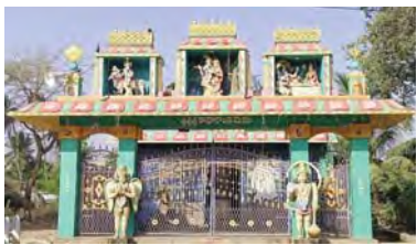
కోటబొమ్మల, మార్చి 10 ప్రభాతవార్త