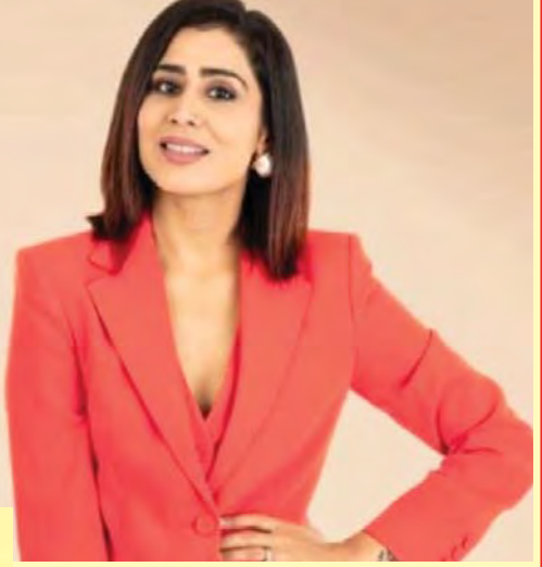
విధానాన్ని గజల్ వివరించింది.

మారిన అంకూర్ణ జయించాలంటోంది గజల్. ఈ పోస్ట్ నేపథ్యంలోనే జీవిత సోపట్ మీడియాలో ఓ పెట్టిందామె. "ఈ ప్రపంచంలో విజయపథంలో దూసుకుపోతున్న వ్యాపారాలన్నీ ఉన్నాయి. మరి, వాటి విజయం సాధించిన ఉమ్మడి అంకూర్ణ మీరు గ్రహించారా? అనే శత్రువు. అయితే శత్రువులతో పోటీదారే కానక్కర్లేదు. వ్యవస్థ. మన స్రవణం, మనకున్న సమస్యలు.. వీటిలో ఉండవచ్చు. ఇలాంటి శత్రువును జయించినప్పుడే ఏ రంగంలోనైనా రాజీంకాలగుంటుంది. ఆగ్రామిగా క్రీడా దుస్తుల పేరొందిన స్వీయ చేస్తూ బ్రాండ్లు చెందిన సంప్రదాయ దీటుగా వసతి కల్పనతో.. ఓవైపు తన సర్వే సీరెట్లను పంచుకుంటూనే.. మరోవైపు 'మీ శత్రువును మీరే నిర్మూలించాలి.. నటిజన్లను సూటిగా ప్రశ్నించింది బిజినెస్ ఉమెన్.