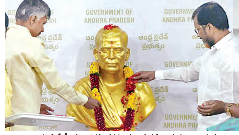
ఆదివారం పాట్లీ శ్రీరాములు విగ్రహంపట్ల నివాళులర్పిస్తున్న సిఎం చంద్రబాబు నాయుడు

అమరావతిలో 'అమరజీవి' 58 అడుగుల విగ్రహం యేడాదిలోగా పార్కు నిర్మాణం చేపడతాం శ్రీరాములు ఇల్లు మ్యూజియంగా అభివృద్ధి 12 నెలలు అమరజీవి 125వ జయంతి ఉత్సవాలు శ్రీరాములు జయంతి వేడుకల్లో సిఎం చంద్రబాబు