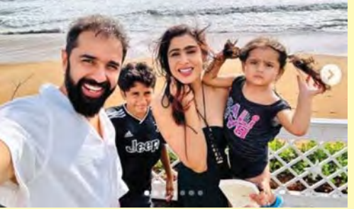
నింపే గజల్.. ఇటీవలే పెట్టిన మరో పోస్ట్ అందరిలో ఆలోచనను రేకెత్తిస్తోంది.

పోతోందామె. అంతేకాదు.. తాను పాటిస్తే వ్యాపార మెలకువలను, ఇతర బిజినెస్ చిట్కాలను తరచూ సోపట్ మీడియాలో పోస్ట్ చేస్తూ బెనెఫిట్ వ్యాపారవేత్తలకు స్ఫూర్తి