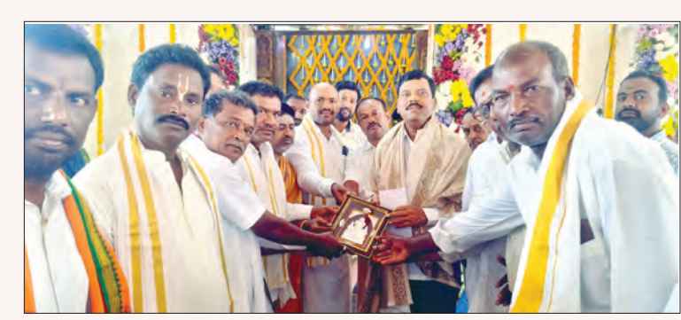
ఎలమంచిలి, మార్చి 09, ప్రభాతవార్త,