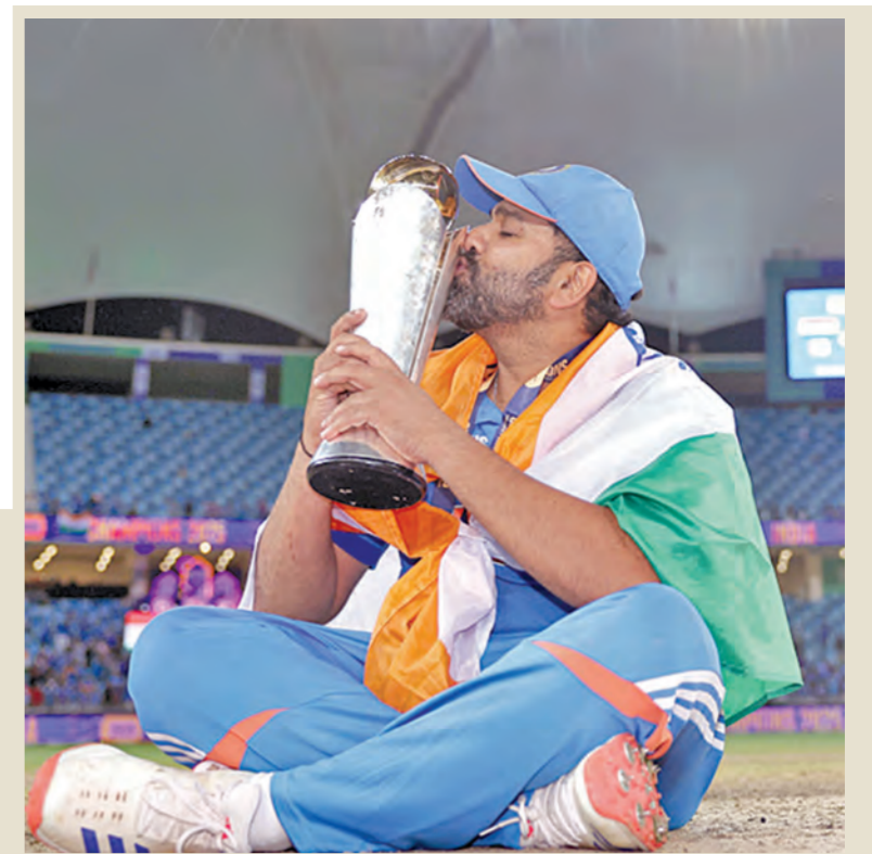
ట్రోఫీని ముద్దాడుతున్న మ్యాన్ ఆఫ్ ది మ్యాచ్ రోహిత్ శర్మ

దుబాయి, మార్చి 9: ఐసిసి ఛాంపియన్స్ ట్రోఫీని టీమిండియా చేజిక్కించుకుంది. దుబాయి వేదికగా ఆదివారం జరిగిన ఐసిసి ఛాంపియన్స్ ట్రోఫీ ఫైనల్లో 252 పరుగుల లక్ష్యాన్ని నిర్దేశిత 50 ఓవర్లలో మరో ఆరు బంతులు మిగిలి ఉండగానే నాలుగు వికెట్ల తేడాతో టీం ఇండియా ఛేదించింది. ఆరు వికెట్లు కోల్పోయి 256 పరుగులు చేసింది. 252 పరుగుల విజయ లక్ష్యంతో బరిలోకి దిగిన టీమిండియా ఓపెనర్లు రోహిత్ శర్మ, శుభమంగిల్ తొలి వికెట్ భాగస్వామ్యునిగా 105 పరుగులు తెచ్చారు. 105 పరుగుల వద్ద మిశేల్ శాంట్టర్ బౌలింగ్లో పిల్చేస్ శుభమంగిల్ క్యాచ్ ఇచ్చివెలియన్ బాబుపట్టాడు. వనపాన బ్యాట్స్ మ్యాన్గా వచ్చిన కోట్లా త్రేన్ వాల్ బౌలింగ్లో ఎట్టిదబ్బు కావడంతో క్రీడాను వదలాల్సి వచ్చింది. తర్వాత వచ్చిన శ్రేయస్ ఆయ్యర్తో కలిసి రోహిత్ శర్మ ఐట్లు స్కోరు వకవూ పెంచడానికి ప్రయత్నించారు. ఈ తరుణంలో 122 పరుగులవద్ద రోహిత్ శర్మ ఐట్ కావడంతో టీమిండియా మూడు వికెట్లకోల్పోయింది. శ్రేయస్ ఆయ్యర్, 29 పరుగులవద్ద, అక్షరవేటిల్ >>2