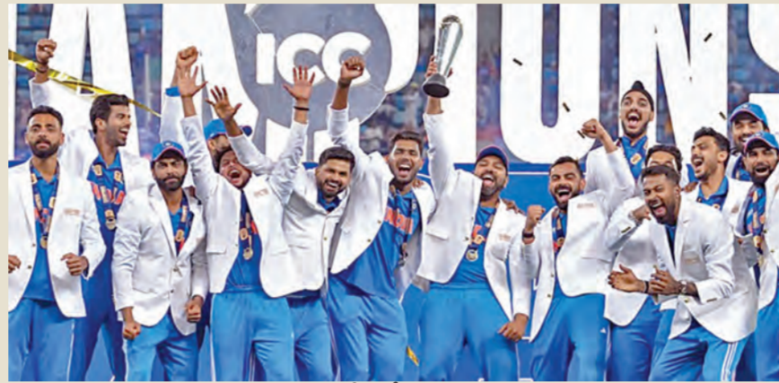
ఐసిసి ఛాంపియన్స్ ట్రోఫీతో టీమిండియా సంబరాలు

ఐసిసి ఛాంపియన్స్ ట్రోఫీ మూడోసారి సాధించిన టీమిండియా నాలుగు వికెట్లు తేడాతో న్యూజిలాండ్పై ఘనవిజయం వరుసగా రెండు ఐసిసి టైటిల్స్ నెగ్గిన రోహిత్ సేన్ దేశవ్యాప్తంగా క్రికెట్ అభిమానుల సంబరాలు