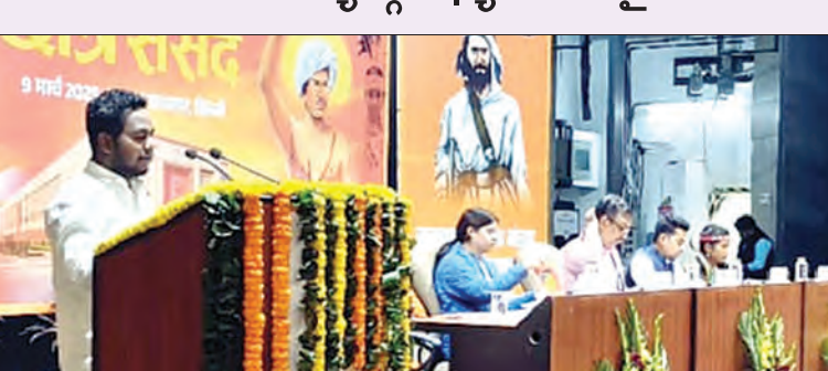
పాడేరు, మార్చి 9, ప్రభాత వార్త: