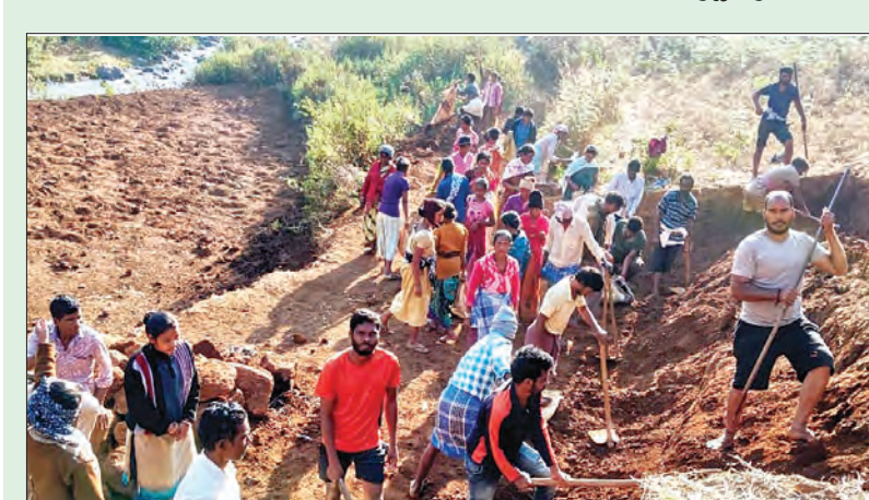
పాడేరు, మార్చి 9, ప్రభాత వార్త: