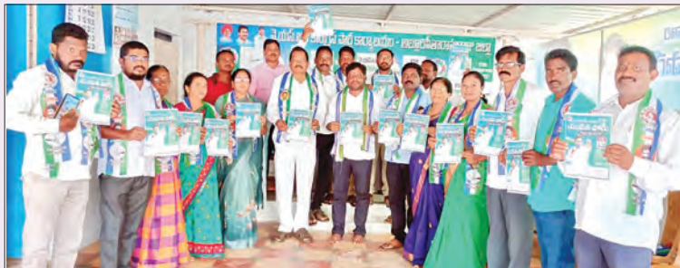
పాడేరు, మార్చి 9, ప్రభాత వార్త: