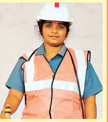
పాసయ్యా. ఈలోగా సింగరేణి నోటిఫికేషన్ రావడం, ఎంపికవ్వడం, రామగుండం 11 ఇంజనీర్ గనికి మమ్మల్ని తీసుకోవడం... అన్న చకచకా జరిగిపోయాయి. నియామకం అంతా అనుకునేంత రిస్కీమీ భూగర్భంలో ఉండదు. 38 శాతం భద్రత కోసం జాగ్రత్తలన్నీ తీసుకుంటాం. ప్రకృతి విపత్తులతో ప్రమాదం ఒక్కో శాతం. అది ఎక్కడైనా తప్పదు. నేనే కాదు, మాతోపాటు చేసిన బాంధవం, అనుభవం... అందరిం ఇష్టంగా పనిచేస్తున్నాం. మున్నందు మరింతోమంది ఈ రంగంలోకి వస్తారనే నమ్మకం ఉంది. □