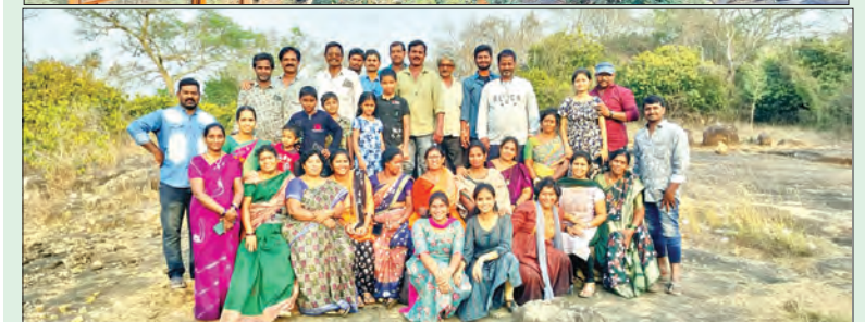
రాజవొమ్మంగి, మార్చి 09, ప్రభాత వార్త

అధ్యాత్మిక పర్యాటకంగా ప్రసిద్ధి చెందిన శతాబ్దచరిత్ర గల జడ్డంగి గ్రామ శ్రీశ్రీశ్రీ శ్రవరాంభికా మల్లిఖార్జునస్వామి అలయంలో పూజలు, సమీపంలో గల జలపాతాలను చూడటానికి పర్యాటకులు తాకిడి రోజు రోజుకూ పెరుగుతుంది. అదివారం కాకినాడ జిల్లా ఎర్రపరం, జగంపేట, రంగంపేట ప్రాంతాల నుండి ప్రత్యేక వాహనాలలో తరలివచ్చారు. మదేరు జలపాతాలు వద్ద స్నానాలు చేసి ఏకరాతి గృహాల కోలువు దీరిన శ్రీశ్రీశ్రీ శ్రవరాంభికా మల్లిఖార్జున స్వామికి పూజలను చేశారు. అలయ పరిసరాల్లో ఆహార పదార్థాలను తయారు చేసేసాని భోజనాలను చేసి సాయంత్రం వరకూ ఉండి తిరిగి వెళ్లారు.