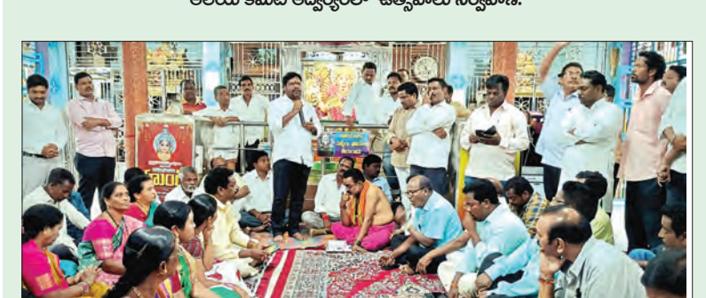
పాడేరు, మార్చి 9, ప్రభాత వార్త: