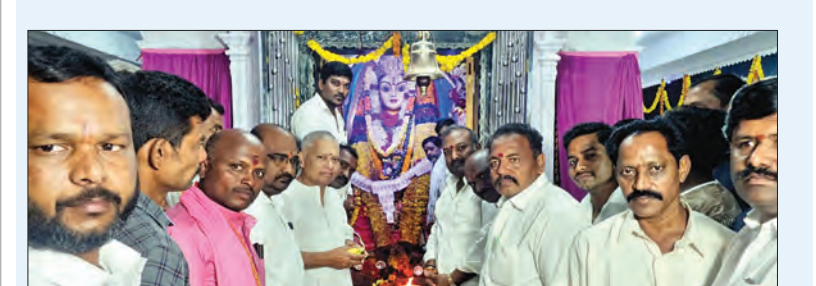
ఎలమంచిలి, మార్చి 09, ప్రభాతవార్త: