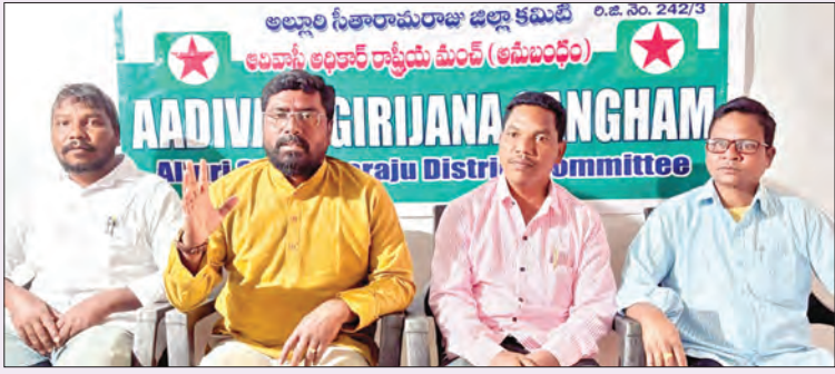
పాడేరు, మార్చి 9, ప్రభాత వార్త:

అదివాసీ గిరిజన సంఘాన్ని విమర్శించే అక్షల రూపాయలు దండుకున్న రాజబాబు: అదివాసీ గిరిజన సంఘం