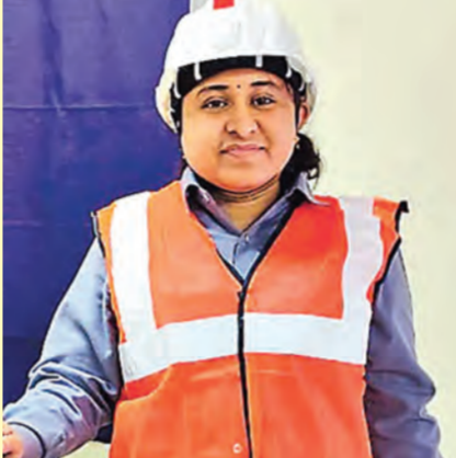
సినియర్ బ్యాచ్ లో నలు గురు ఫోర్ట్ ఇయర్ లో ఉండగా సింగరేణి ప్రకటన వచ్చింది. అందులో 'ఒప్పి' ఫర్ మెన్ అని చూసి కంగుతిన్నాం. చదవడంతోనే సీటిచ్చారు. ఉద్యోగానికి ఎందుకొచ్చి మా చదువుకి అడ్డం లేదా అనిపించింది. 1952వారి గమల చట్టం ప్రకారం ఓపెన్ క్యాన్సి గనుల్లో ఉదయం నుండి 6 సాయంత్రం 7 వరకు పనిచేయడానికి అమ్మాయిలు అర్హులే. దానికో 2017లో మా బ్యాచ్ ఎదుగుతూ ఢిల్లీ వెళ్ళాం అప్పటికి మాలో ఎవ్వరూ రాష్ట్రం దాటలేదు. కానీ డైరెక్టర్ చేశాం. పాఠశాల మనీతోనే ప్లాన్ చేసుకున్నాం. కేంద్ర క్యాంపకాగా మంత్రి సంతోష గంగూర్ని కలిసి వాణి పీటీఎస్ దాఖలు చేశాం. తోటి ఎంపికైనా, కాలేజీ యాజమాన్యం మద్దతుగా నిలిచింది. ఎట్టకేలకు 2019లో చట్టాన్ని సవరించారు. భూగర్భగనిలోకి అనుమతి వచ్చింది. అయితే, గతంలో కనుగురు అమ్మాయిలు కలిసి పనిచేయాలి అని చెప్పారు. ఆ తరువాత కొన్ని ప్రైవేట్ ఫస్ట్ అమ్మాయిల్ని తీసుకొచ్చారు. కానీ గనుల్లోని రిమోట్ ఏరియాలో ఉండటం, రిస్క్ తీసుకోలేం అని వారామంది అవకాశం ఇచ్చేవారు కాదు. ఈలోగా ఎంపిక చేసి ఆసిస్టెంట్ ప్రొఫెసర్ గా చేరాం తాజాగా సింగరేణి నోటిఫికేషన్ లో అమ్మ చేశా. నాతో కలిసి 23 వంతు అమ్మాయిలు. రామగుండం