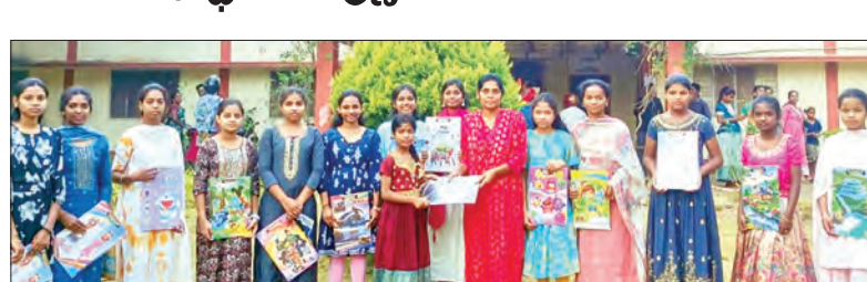
అరకులోయ, మార్చి 9, ప్రభాత వార్త :-