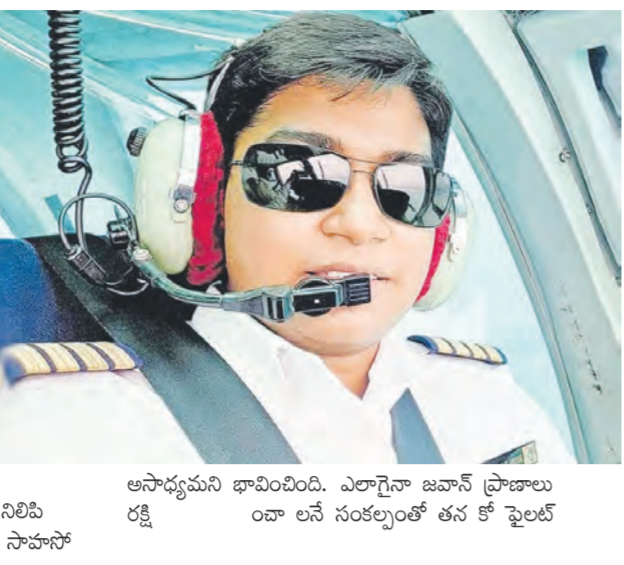
అసాధ్యమని భావించింది. ఎలాగైనా జవాన్ ప్రాణాలు రక్షింపాలని సంకల్పంతో తన కో పైలట్

అదో మావోయిస్టుల ఉనికి ఉండే అత్యంత కఠినమైన దండకారణం. సాధారణంగా దండకారణంలోకి అడుగుపెట్టాలంటేనే ఒకరకమైన వణకు పుడుతుంది. అందులోనూ ఆది నక్కల్ని ప్రభావితం చేయడం. ఏ క్షణాన ఎటువైపునూ ఉంటే వరం కురుస్తుందో తెలియని అతి భయంకరమైన ప్రాంతమిది. మహారాష్ట్రపతీనిగ్డ సరిహద్దుల్లో మావోయిస్టుల కీలక స్థావరం అయిన అమజీమర్ ప్రాంతం 21 ఆక్టోబర్ 2024న మావోయిస్టు పరియటా పోలీసుల మధ్య ఉద్రిక్త వాతావరణంలో కాల్యులతో ఎనిమిది గంటలపాటు దృఢనిరోధం ఉంది. ఆ కాల్యుల్లో క్రమశిక్షణపై 60 కమాండో శరీరంలోకి మూడు బుల్లెట్లు దూసుకుపోగా, తీవ్ర రక్తస్రావంతో మూడు గంటలపాటు కొట్టుమిట్టాడుతున్న అయినను దైర్యవంతులారైన మహిళా హెలికాప్టర్ పైలట్ భూమికే కేవలం 11 అడుగుల ఎత్తులో హెలికాప్టర్ నిలిపి అందులో నుండి దూకి సమయస్ఫూర్తితో, అత్యంత సాహసో