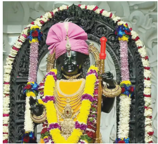
अयोध्या में होली के मौके पर रामलला ने धनुष की जगह सोने की पिचकारी धारण की

रामलला के हाथों में धनुष की जगह पिचकारी; संभल में मस्जिद के सामने से जुलूस निकला; बॉर्डर पर बीएसएफ जवानों ने खेली होली