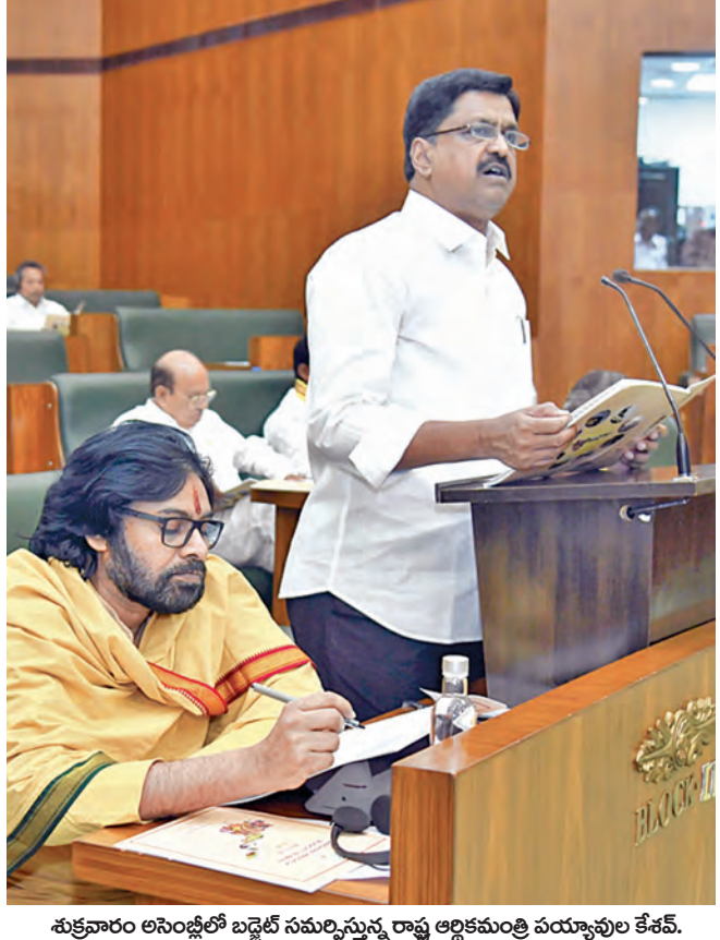
శుక్రవారం అసెంబ్లీలో బడ్జెట్ సమర్పించును రాష్ట్ర ఆర్థికమంత్రి పయ్యపుల కేశవ్.

1-3-2025 శనివారం సంపుటి: 31 సంఠి: 28 పేజీలు: 10+4 వెలు: 6.50