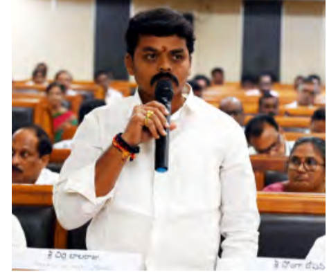
అనేక గిరిజనులు ఉన్నటువంటి వారి గిరిజనులు ఉండే హక్కు కోల్పోతున్నారు. వారిని ఏజెన్సీ కలుపుటకు మన ప్రభుత్వం ఏ విధమైన చర్యలు తీసుకుంటుంది. సంబంధిత బడీడీఏ లో చేర్చి వారికి చేయూత అందించాలి.

జింగరెడ్డిగూడెం, ప్రభాత వార్త: అసెంబ్లీ సమావేశంలో హోలవరం ఎమ్మెల్యే చిల్ల బాలరాజు అదివాసల తరఫున అసెంబ్లీలో వారికి గత ప్రభుత్వంలో జరిగిన అన్యాయాలను సరి చేస్తూ, మన ఎమ్మెల్యే కూటమి ప్రభుత్వంలో గిరిజనులను అదుకోవాలని కోరారు. హోలవరం నియోజకవర్గం అభివృద్ధిలో కృషి చేయాలని కోరారు. జీవో నెంబర్ 3 ని గతంలో సుప్రీంకోర్టు ద్వారా చేసింది దీనివల్ల రాష్ట్ర ప్రభుత్వం ఉన్నటువంటి గిరిజన ఆందోళన చెందుతున్నారని. గత ప్రభుత్వాన్ని నిర్లక్ష్యం వల్ల వ్యవహారం సరైన వాదనలు వినిపించలేదు ఎన్ డి ఎ కూటమి ప్రభుత్వం జీవో నెంబర్ 3 ని ఏమైనా చేయగలదా కచ్చితంగా 60 నెంబర్ 3 ని అమలు చేయాలి. వైఎస్ఆర్ఎస్ ప్రభుత్వం లో ఏజెన్సీ ప్రాంతంలో ఉండే బడీడీఏ లను సంబంధించి ట్రైబ్యూనల్ సమైక్యంగా సరిగ్గా కేటాయించలేదు బడీడీఏలో వైటిసీ సంస్థలు సంబంధించి గత ప్రభుత్వంలో గిరిజన నిరుద్యోగ యువత వైటిసీ ద్వారా ఉపాధి అవకాశాలు కల్పించలేకపోయింది. ఎన్ డి ఎ కూటమి ప్రభుత్వం దీనిపై ఏమీ తీసుకుంటుందో తెలపగలరు. కచ్చితంగా ట్రైబ్యూనల్ సమైక్యంగా కేటాయించగలరు. మైన్ ఏరియాలో ఉన్నటువంటి