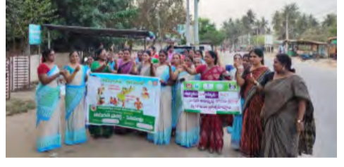
అన్నారు. చిన్న వయసులోనే వివాహాలు చేయడంవలన పిల్లల