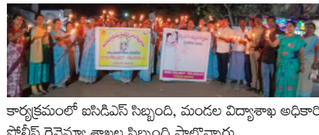
కార్యక్రమంలో ఐసిడిఎస్ సిబ్బంది, మండల విద్యాశాఖ అధికారి, పోలీస్ రెవెన్యూ శాఖల సిబ్బంది పాల్గొన్నారు.

పోడూరు, మార్చి-04, ప్రభాతవార్త: మండలంలోని కవలం గ్రామంలో అంతర్జాతీయ మహిళా దినోత్సవం సందర్భంగా సోమవారం కోవొత్తల రైల్వే ఐసిడిఎస్ ఆధ్వర్యంలో జరిగింది. ఈ సందర్భంగా బాల్యవివాహాల నిషేధం, ఆడపిల్లలను పట్టణీకరణం, ఎడగనిడ్డం, చదివిడ్డం, రక్షణం అనే నినాదాలతో ఈ ర్యాలీ ముందుకు సాగింది. ఈ