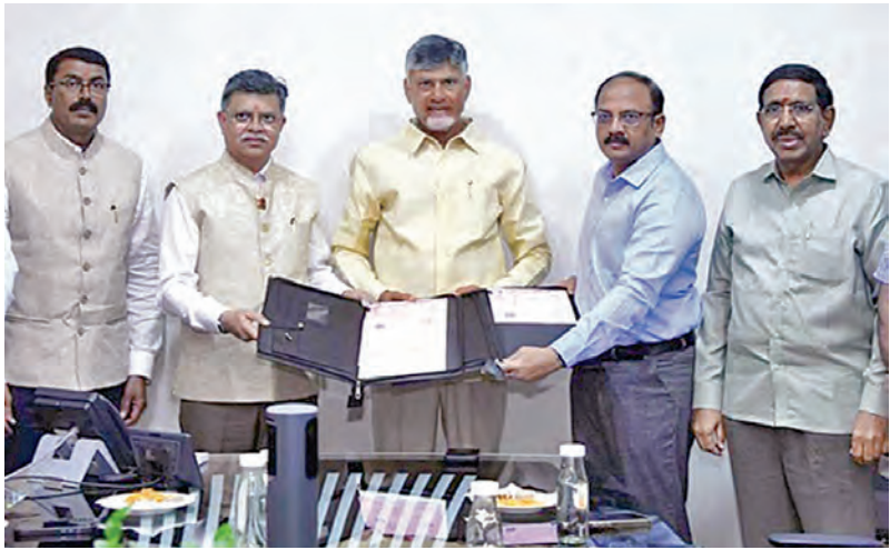
అధికారం చంద్రబాబు సమక్షంలో హాదో, సిఆర్డీల మధ్య ఒప్పందం చేసుకుంటున్న దృశ్యం