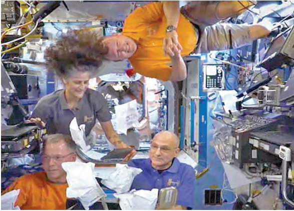
న్యూయార్క్, మార్చి 16: అంతర్జాతీయ అంతరిక్షకేంద్రం ఐఎస్ఎస్ లోనే తొమ్మిది నెలలుగా బిక్కుకుపోయిన భారత సంతతికి చెందిన సునీతా విలియమ్స్ మరో వ్యోమాగామి బుద్ధివంతంగా త్వరలోనే భూమిపైకి రానున్నట్లు ప్రకటించారు. వారిని తిరిగి తీసుకొచ్చేందుకు నాసా స్పేస్ఎక్స్ లు ప్రయోగించిన క్రూ-10 మిషన్ ఐఎస్ఎస్ తో విజయవంతంగా అనుసంధానం అయింది. ఆదివారం ఉదయం 9.37 గంటలకు ఈ ప్రకటన

గ్యాంగ్టక్, మార్చి 16: ఐఐఐఐ విద్యార్థులతో వెళుతున్న బస్సు ఒక్కసారిగా అదుపుతప్పి లోయలో పడిపోయింది. ఘాటోద్ధరలో వెళుతున్న బస్సు డ్రైవర్ అదుపు తప్పడంతో లోయలోకి దూసుకునిపోయిందని పోలీసులు తెలిపారు. ఈ ప్రమాదంలో పదిమంది గాయపడ్డారు. వారందరినీ ఆసుపత్రికి తరలించి చికిత్స అందిస్తున్నారు. సిక్కిం లోని మంగన్ జిల్లాలో ఈ సంఘటన జరిగింది. శనివారం రాత్రి 9.30 గంటల సమయంలో ఐఐఐఐ ధన్బాద్ విద్యార్థులతో వెళుతున్న బస్సుపై డ్రైవర్ నియంత్రణ కోల్పోయాడు. దాదాపు ప్రాంతంలోని వర్షే సమీపంలో ఆ బస్సు ప్రమాదానికి గురైంది. వంద అడుగుల లోయలోకి దూసుకుపోతూ బోల్తా పడింది. బస్సు ప్రమాదం వెంటనే వెంటనే పోలీసులు, భద్రతా సిబ్బంది సంఘటనా స్థలానికి చేరుకున్నారు. సహాయక చర్యలు చేపట్టారు. ఈ ప్రమాదంలో డ్రైవర్ సహా పదిమంది గాయపడినట్లు అధికారులు తెలిపారు. గాయపడిన విద్యార్థుల్లో నలుగురు మహిళలు ఉన్నారు. మల్తీమగ్గరి పరిస్థితి విషమంగా మారడంతో గ్యాంగ్టక్ లోని ఆసుపత్రికి తరలించారు. మిగిలిన విద్యార్థులకు మంగన్ లోని ఆసుపత్రిలో చికిత్స అందిస్తున్నట్లు తెలిపారు.