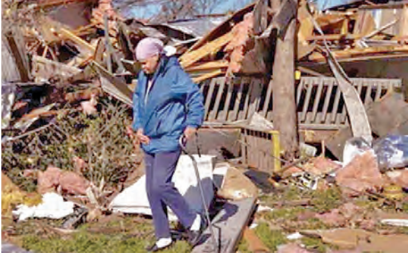
వాషింగ్టన్, మార్చి 16: అగ్రరాజ్యం అమెరికాను భీకర తుపానులు వణికిస్తున్నాయి. పెద్ద ఎత్తున టోర్నాడోలు విరువకుపడుతున్నాయి. బలమైన గాలుల కారణంగా అనేక ఇళ్లు నేలమట్టం అయ్యాయి. ఈ తుపాను ధాటికి అమెరికా వ్యాప్తంగా 34 మంది ప్రాణాలు కోల్పోయారు. మిస్సోరి లోని బేకర్స్ ఫీల్డ్ లో టోర్నాడో కారణంగా 12 మంది మృతిచెందారు.

అగ్రరాజ్యం రాష్ట్రంలోని ఇండిపెండెన్స్ కౌంటీలో ముగ్గురు చనిపోయారు. ఎనిమిది కౌంటీల్లో 50 మందికిపైగా గాయపడినట్లు అగ్రరాజ్యం అధికారులు చెప్పారు. రాష్ట్ర వ్యాప్తంగా 16 కౌంటీల్లో భారీగా ఆస్తినష్టం సంభవించినట్లు పేర్కొన్నారు. అనేక ఇళ్లు ధ్వంసం అయినట్లు చెప్పారు. విద్యుత్ లైన్లు, చెట్లు కూలిపోయాయని పబ్లిక్ సేఫ్టీ విభాగం వెల్లడించింది. గవర్నర్ సారా హుకాబీ శుందర్ అత్యవసరపరిస్థితిని ప్రకటించారు. అధ్యక్షుడు ట్రంప్ తో తానుమాట్లాడాడని ప్రకటించారు. అతడిపేరుకూడా ఉంది. అయిన హామీ ఇచ్చినట్లు చెప్పారు. టెక్సాస్ లోని హ్యూస్టన్ లోని అమెరికన్ కౌంటీలో దుమ్ముతుపాను కారణంగా జరిగిన కాల్ ప్రమాదాల్లో ఏడుగురు చనిపోయారు. మరొకరు మిసిసిప్పీలో చనిపోయారు. అమెరికా మొత్తంగా బలమైన గాలులు ప్రభావంవల్ల అనేక ప్రాంతాల్లో చనిపోయిన వారి సంఖ్య అనేకమంది ఉంది. 100కిపైగా అడవుల్లో మరణాలు చెలరేగినట్లు తెలిసింది. ముందురోజు సంభవించిన టోర్నాడోల కారణంగా తూర్పు లూసియానా, మిసిసిప్పీ, అలబామా, పశ్చిమ జార్జియా, ఫ్లోరిడా, పాన్ హ్యాండ్ లో ప్రాంతాలు తీవ్రంగా ప్రభావితం అయ్యాయి. టోర్నాడోలు మరన్ని వచ్చే అవకాశం ఉంది. అందులో కొన్ని ప్రమాదకరస్థాయిలో ఉండవచ్చని జాతీయ వాతావరణ సేవ విభాగం హెచ్చరించుచేసింది. టెక్సాస్, కన్యాస్, దక్షిణ అమెరికా రాష్ట్రాల్లో దీని ముప్పు ఎక్కువగా ఉంటుందని తెలిపారు.