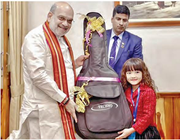
న్యూఢిల్లీ, మార్చి 16: కేంద్ర హోంమంత్రి అమిత్ షా ఈశాన్య రాష్ట్రాల్లో పర్యటిస్తున్నారు. ఈ క్రమంలో మిజోరాంలో జరిగిన ఓ కార్యక్రమంలో

జరిగిందని నాసా వెల్లడించింది. ఇందుకు సంబంధించిన విడియోను కూడా స్పేస్ఎక్స్ విడుదలచేసింది. సునీతా విలియమ్స్ మరో వ్యోమాగామి బుద్ధివంతంగా స్పాస్ లో తాజాగా అక్కడికి వెళ్లిన నలుగురు వ్యోమాగాములు పనిచేస్తున్నారని. క్రూ-10 మిషన్లో భాగంగా స్పేస్ఎక్స్ కు చెందిన ఫాల్కన్-9 రాకెట్ దీన్ని నింగ్లోకి మోసుకెళ్లింది. ఇందులో అమెరికాకు చెందిన ఆన్ మెక్ కెయిన్, సికోల్ ఆయర్స్, జపాన్ వ్యోమాగామి టకయాబానీ, రష్యాకు చెందిన కిరిలిపెస్కోవ్లు ఐఎస్ఎస్ కు చేరారు. వీరికి సునీతా విలియమ్స్ స్వాగతం పలికారు. బెస్ట్ మిషన్ కోసం బోయింగ్ కు చెందిన స్పాస్ లో అంతరిక్ష నౌకలో విలియమ్స్, విల్మోర్లు 2024 జూన్ 5న అంతరిక్షంలోకి వెళ్లారు. ఎనిమిదిరోజుల తర్వాత వారు భూమికి రావాల్సి ఉంది. అయితే స్పాస్ లోనే స్టేషన్ లోనే తిరుగుతూ తర్వాత భూమికి రావాలని ప్లాన్ చేసుకున్నారు. ఈ నేపథ్యంలో వ్యోమాగాములను ఈనాటికి తిరిగి భూమిపైకి తీసుకురావడం సురక్షితం కాదని అగస్టు నెలాఖరునాటికి వారి ఒక నిర్ణయానికి వచ్చింది. దీనితో వ్యోమాగాములు లేకుండా బోయింగ్ స్పాస్ లైన్ 2024, సెప్టెంబరు 7న క్షేమంగా భూమికి తిరిగి వచ్చింది అవుతినని ప్రకటించి, విల్మోర్లు అంతరిక్షంలోనే ఉండిపోయారు. తిరిగి ఇప్పుడు ఈనెల 19,20 తేదీలనాటికి వారు క్రూ-10 క్యాప్సుల్ లోనే తిరిగి భూమికి రానున్నారు.