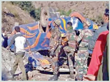
లోయలో పడిన ఐఐఐఐ విద్యార్థుల బస్సు

గ్యాంగ్టక్, మార్చి 16: ఐఐఐఐ విద్యార్థులతో వెళుతున్న బస్సు ఒక్కసారిగా అదుపుతప్పి లోయలో పడిపోయింది. ఘాటోద్ధరలో వెళుతున్న బస్సు డ్రైవర్ అదుపు తప్పడంతో లోయలోకి దూసుకునిపోయిందని పోలీసులు తెలిపారు. ఈ ప్రమాదంలో పదిమంది గాయపడ్డారు. వారందరినీ ఆసుపత్రికి తరలించి చికిత్స అందిస్తున్నారు. సిక్కిం లోని మంగన్ జిల్లాలో ఈ సంఘటన జరిగింది. శనివారం రాత్రి 9.30 గంటల సమయంలో ఐఐఐఐ ధన్బాద్ విద్యార్థులతో వెళుతున్న బస్సుపై డ్రైవర్ నియంత్రణ కోల్పోయాడు. దాదాపు ప్రాంతంలోని వర్షే సమీపంలో ఆ బస్సు ప్రమాదానికి గురైంది. వంద అడుగుల లోయలోకి దూసుకుపోతూ బోల్తా పడింది. బస్సు ప్రమాదం వెంటనే వెంటనే పోలీసులు, భద్రతా సిబ్బంది సంఘటనా స్థలానికి చేరుకున్నారు. సహాయక చర్యలు చేపట్టారు. ఈ ప్రమాదంలో డ్రైవర్ సహా పదిమంది గాయపడినట్లు అధికారులు తెలిపారు. గాయపడిన విద్యార్థుల్లో నలుగురు మహిళలు ఉన్నారు. మల్తీమగ్గరి పరిస్థితి విషమంగా మారడంతో గ్యాంగ్టక్ లోని ఆసుపత్రికి తరలించారు. మిగిలిన విద్యార్థులకు మంగన్ లోని ఆసుపత్రిలో చికిత్స అందిస్తున్నట్లు తెలిపారు.