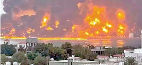
సనా, మార్చి 16: యెమెన్ లోని హాతీలపై అమెరికాలోని ట్రంప్ సర్కారు సైనిక చర్యను మొదలుపెట్టింది. ఎర్ర సముద్రంలో వాణిజ్యనౌకల లక్ష్యంగా దాడులుచేస్తున్న యెమెన్ తిరుగుబాటుదళాలకు ఇక అమెరికా మళ్లీ దాడులు చేసినట్లు యెమెన్ రాజధాని సనా, సనా, అలీబైదా, రాదాల్ లక్ష్యంగా దాడులు కొనసాగించింది. ఇప్పటివరకు 34 మంది మృతిచెందారని, 101 మంది గాయపడినట్లు హాతీ ఆరోపించింది. మృతుల్లో మహిళలు,

చిన్నారై ఎక్కువ ఉన్నట్లు హాతీ ఆరోగ్యమంత్రిత్వ శాఖ తెలిపింది. అమెరికా నౌకలు, విమానాలపై హాతీలు దాడులుచేయడాన్ని సహించేదిలేదని యుఎస్ సెంట్రల్ కమాండ్ వెల్లడించింది. అగ్రరాజ్యం దాడులను హాతీ పోలిటికల్ బ్యూరో యుద్ధనీరంగా పేర్కొంది. యెమెన్ దళాలు ప్రతిస్పందించేందుకు సిద్ధంగా ఉన్నాయని హెచ్చరించింది. తిరుగుబాటుదారులపై అమెరికా అధ్యక్షుడు ట్రంప్ దృవపాటారు. హాతీలు మీకు మీ సమయం ఆసన్నమైంది. మీ దాడులు వెంటనే ఆపాలి ఉపాధి పరిష్కారాలు ఎదుర్కోవాలని అని ఆయన ట్రూత్ సోఫర్ మీడియాలో పోస్ట్ చేసారు. ప్రపంచ జలమార్గాల్లో అమెరికా వాణిజ్య యుద్ధనౌకలు స్వేచ్ఛగా వెళ్లకూడదా అనేకే వీరే ఉగ్రశక్తి లేదన్నారు. హాతీలకు మద్దతివ్వడాన్ని నిరసిచేయాలని ఇరాన్ ను హెచ్చరించారు. వారి చర్యలకు ఇకపై దాడులు జరిగితే అందుకు ఇరాన్ పూర్తి బాధ్యత వహించాల్సి ఉంటుందని స్పష్టంచేసారు. కాగా అమెరికా దాడులతో సనా పరిసర ప్రాంతాల్లో భూమి కదిలింది. దీనితో అందరూ భూకంపం వచ్చిందని భయపడినట్లు చెప్పారు.