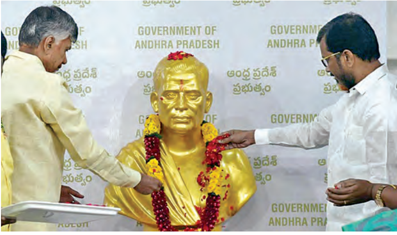
ఆదివారం పొట్టి శ్రీరాములు విగ్రహంపట్ల నివాళులర్పిస్తున్న సిఎం చంద్రబాబు నాయుడు

అమరావతిలో 'అమరజీవి' 58 అడుగుల విగ్రహం యేడాదిలోగా పార్కు నిర్మాణం చేపడతాం శ్రీరాములు ఇల్లు మ్యూజియంగా అభివృద్ధి 12 నెలలు అమరజీవి 125వ జయంతి ఉత్సవాలు శ్రీరాములు జయంతి వేడుకల్లో సిఎం చంద్రబాబు