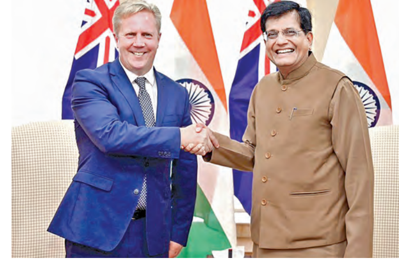
అధికారం న్యూఢిల్లీలో భారత్, న్యూజిలాండ్ ప్రతినిధులు సమావేశమైన దృశ్యం

న్యూయార్క్ మార్చి 16: అంతరాజీయ అంతర్జాతీయ కేంద్రాలా నికి ఎనిమిది రోజుల పర్యటనకు వెళ్లిన సునీతా విలియమ్స్, బుచ్ విల్లోర్లు సుమారు తొమ్మిది నెలలు అక్కడే గడిపిన సంగతి తెలిసింది. సుదీర్ఘకాలం అంతర్జాతీయ కేంద్రాలా అంతర్జాతీయ కేంద్రాలా నందుకు నానా వీరికి అదనపు చెల్లింపులు చేస్తుంది అన్న అంశం అసక్తికరంగా ఉంది. అంతర్జాతీయ నిర్దేశిత సమయం కంటే ఎక్కువకాలం పనిచేసిన నానా విలియమ్స్, బుచ్విల్లోర్లకు అదనపు చెల్లింపులు చేస్తుంది అన్న అంశం అసక్తికరంగా ఉంది. అంతర్జాతీయ నిర్దేశిత సమయం కంటే ఎక్కువకాలం పనిచేసిన నానా విలియమ్స్, బుచ్విల్లోర్లకు అదనపు చెల్లింపులు చేస్తుంది అన్న అంశం అసక్తికరంగా ఉంది. అంతర్జాతీయ నిర్దేశిత సమయం కంటే ఎక్కువకాలం పనిచేసిన నానా విలియమ్స్, బుచ్విల్లోర్లకు అదనపు చెల్లింపులు చేస్తుంది అన్న అంశం అసక్తికరంగా ఉంది.