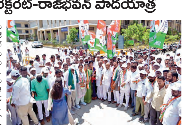
కలెక్టరేట్ నుంచి రాజీభవన్ వరకు బయలుదేరిన పాదయాత్ర

సమస్యల పట్టించుకోకుండా ఫాలోనీకు పరిమితం అయినా మాజీ సిఎం, గజెట్లో అమ్మమ్మ గెలిపిస్తే ప్రజల మధ్యకు రావాలని ప్రజలకు తెలిపారు. కెసిఆర్ అయిన మాట్లాడుతూ కెసిఆర్ అసెంబ్లీకి వెళ్ళకుండా ఇప్పటి వరకు రూ.58 లక్షల జీతం మాత్రం తీసుకున్నారని తెలిపారు. నియోజకవర్గానికి రాకుండా ప్రజల