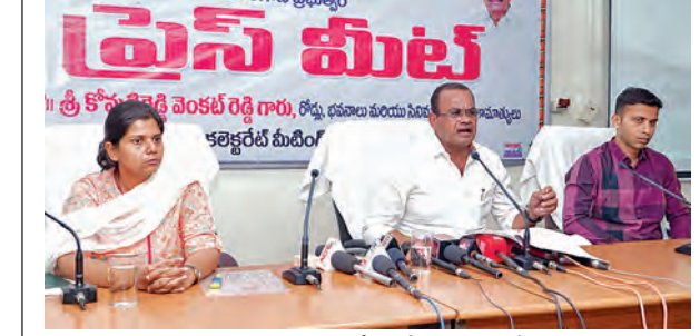
గురువారం సర్పంచ్ జిల్లా కలెక్టరేట్లో మీడియాతో మాట్లాడుతున్న మంత్రి కోమటిరెడ్డి వెంకటరెడ్డి

సర్పంచ్ ప్రతినిధి, ప్రభాతవార్త, మార్చి 20: ఆందోళన ప్రతిఫలాల అందించే బడ్జెట్లో ప్రయత్నం వడం జరిగిందని రోడ్డు, భవనాలు, సినిమాల్లో గ్రామీణ శాఖ మంత్రి కోమటిరెడ్డి వెంకటరెడ్డి తెలిపారు. గురువారం ఆయన సర్పంచ్ జిల్లా కలెక్టర్ కార్యాలయంలో మీడియా సమావేశంలో మాట్లాడారు. బడ్జెట్లో ఇరిగేషన్ పెద్దపీటెయ్యగా, అందులో సర్పంచ్ జిల్లా ముందుండన్నారు. సర్పంచ్ జిల్లాలో ఈ రివెన్యూ లక్ష ఎకరాల ఆయకట్టు పెరిగిందని, దీని ద్వారా దాన్యం దిగుబడి పెరిగినప్పటికీ రైతులకు ఎలాంటి ఇబ్బంది లేకుండా ధాన్యాన్ని కొనుగోలు చేసేందుకు ధాన్యం కొనుగోలు కేంద్రాలను ఏర్పాటుచేసి ధాన్యాన్ని కొనుగోలు చేస్తామని త్వరలోనే ధాన్యం కొనుగోలు కేంద్రాలను