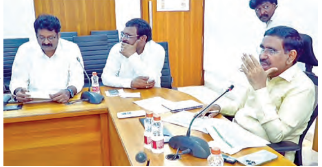
శుక్రవారం సచివాలయంలో విశాఖ ఎమ్మెల్యేలు, జెఎస్ ఖేటీ అధికారులతో సమీక్షిస్తున్న మంత్రి పి.నారాయణ

నాలుగు నెలల్లోగా సిద్ధం మెట్రో రైలు ఈ బృహత్తరణకలో భాగమే రోడ్ల విస్తరణకు చర్యలు: మంత్రి నారాయణ >>2