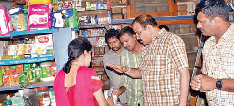
మెడికల్ షాపులపై దాడుల దృశ్యం

'అపరేషన్ గరుడ' పేరుతో మెడికల్ షాపులపై విస్తృతంగా దాడులు ఎన్ఆర్ఐ డ్రగ్స్ను గుర్తించిన అధికారులు విజయవాడ,మార్చి21 ప్రభాతవార్త: పిఎల్ అపరేషన్ గరుడ నిర్వహించారు. అపరేషన్ గరుడలో భాగంగా డిజిటీ అవకాశం మేరకు ఇటీవల కేంద్ర టీఎం, విజిలెన్స్ ఎండ్ ఎన్ఫోర్స్ మెంట్, లోకల్ పోలీస్, డ్రగ్స్ కంట్రోల్ టీమ్ ఆధ్వర్యంలో రాష్ట్రవ్యాప్తంగా దాడులు జరుగుతున్నాయి. డ్రగ్స్ దుర్వినియోగంపై రాష్ట్రవ్యాప్తంగా మెడికల్ షాపులు, ఏజెన్సీస్పై అధికారులు దాడులు చేస్తున్నారు. మెడికల్ షాపుల్లో అక్రమ మందులదారులు ఉన్నాయా అనే దానిపై అధికారులు తనిఖీలు చేపట్టారు. విజయవాడనగర వ్యాప్తంగా మెడికల్ షాపులపై కేంద్ర టీఎం దాడులు నిర్వహించారు. కేంద్ర టీఎం డి.ఎన్.ఎం.ఆర్.లో భాగంగా 100 టీఎం షాపులపై దాడులు చేస్తున్నారన్నారు. డ్రగ్స్ కేంద్ర టీఎం ఉత్సాహం మోపుతోందని తెలిపారు. యువత డ్రగ్స్, గంజాయి అందు >>2