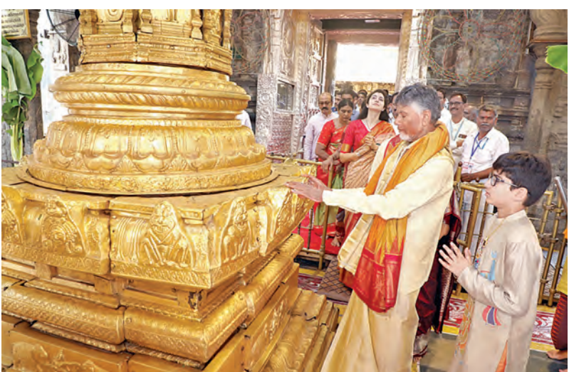
శుక్రవారం తిరుమలలో ధ్వజారోహణం వద్ద ప్రజామిత్రులను సీఎం చంద్రబాబు, మనుమడు దేవాస్