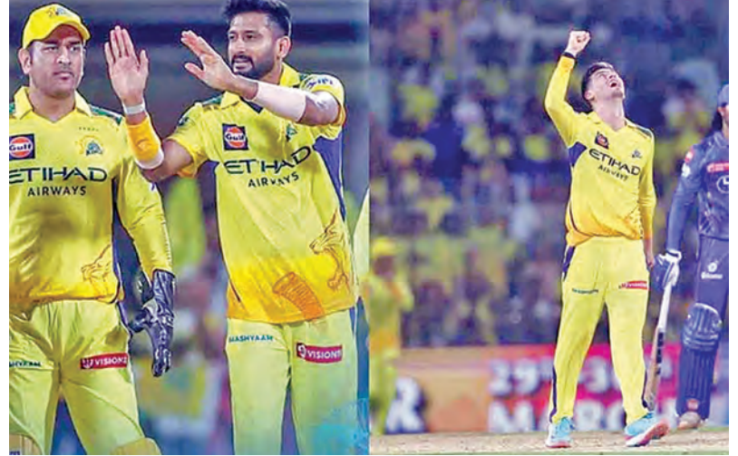
రెండు పరుగులతో నిరాశపరిచాడు. ఈ దశలో క్రీజాలోకి వచ్చిన కెప్టెన్ రుతురాజ్ గైక్వాడ్ ధాటిగా బ్యాటింగ్ చేశాడు. ఫలితంగా చెన్నై సూపర్ కింగ్స్ లక్ష్యంపై పరుగులుతీసింది. రవీంద్రేంద్ర ఒక ఎండ్ లో అతివేగంతో మరో

చెన్నై, మార్చి 23: ఐపీఎల్ లో ఐదుసార్లు ఛాంపియన్ గా నిలిచిన చెన్నై సూపర్ కింగ్స్ 2025 ఐపీఎల్ లో బీజేసీసీంది. అధికారం చేపాక్ వేదికగా జరిగిన మ్యాచ్ లో తన ప్రత్యర్థి ముంబయి ఇండియన్స్ పై నాలుగు వికెట్ల తేడాతో గెలిచింది. 156 పరుగుల లక్ష్యాన్ని 19.1 ఓవర్లలో అనువికెట్లను పూర్తి చేసి చెన్నై జట్టు ఛేదించి విజయం అందుకుంది. చెన్నై కెప్టెన్ రుతురాజ్ గైక్వాడ్ 26 బంతుల్లో ఆరుఫోర్స్, మూడు సిక్స్లతో 53 పరుగులు చేశాడు. చెన్నై గెలుపులో కీలకంగా నిలిచాడు. రవీంద్రేంద్ర 45 బంతుల్లో రెండు ఫోర్స్ నాలుగు సిక్స్లతో 45 బంతుల్లో 65 పరుగులుచేసి నాటోగా నిలిచాడు. చివరివరకూ క్రీజంలో ఉండి చెన్నైని గెలిపించారు. ముంబై తరఫున విగ్గీకేప్టెన్ 3 వికెట్లతో మెరిసాడు. విన్ డెన్కా ఉండటంతో సిఎస్కే లక్ష్యచేదన తడబడుతూనే ఆరంభించింది. రాహుల్ త్రిపాఠి