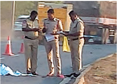
గవర్నమెంట్ ఆసుపత్రికి తరలించి కేసు నమోదు చేసి దర్యాప్తు చేశారు.

వెంకటాచలం (నెల్లూరు), మార్చి 23 ప్రభాతవార్త : కారు, స్కూటర్ ఢీ కొని ఒకరు మృతి చెందిన సంఘటన వెంకటాచలం మండలంలోని గోల గొమ్మడి రోడ్డు వద్ద చోటు చేసుకుంది. వివరాలు తెలుసుకుంటే... గుడూరు వెళ్తున్న కారు అతి వేగంగా రావడంతో గోలగొమ్మడి రోడ్డు వద్ద స్కూటర్ ఢీ కొంది. ఈ ప్రమాదంలో స్కూటర్ డ్రైవర్ చేస్తున్న వ్యక్తి అక్కడికక్కడే మృతి చెందాడు. మృతి చెందిన వివరాలు లభ్యం కాలేదు. దీంతో వెంకటాచలం ఎస్పీ ఆజీస్ యులు మృత దేహాన్ని పోస్టు మాట్రికి నిర్మూలన