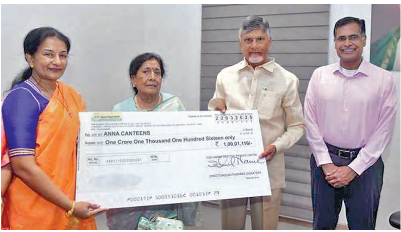
అన్న క్యాంటీన్ నిర్వహణ కోసం చంద్రబాబు రూ.కోటి విరాళం చెక్కు అందిస్తున్న రంగారావు కుటుంబ సభ్యులు