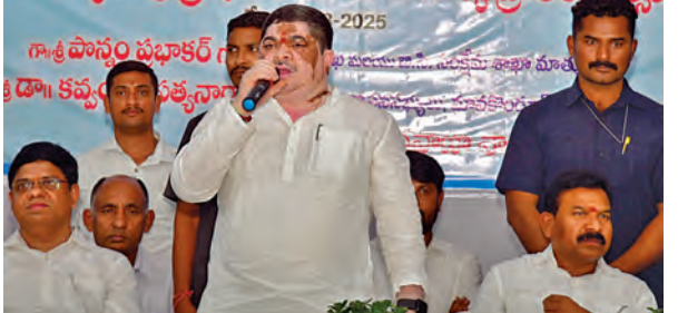
అధికారం తిమ్మాపూర్ లోని రవాణా శాఖ కార్యాలయంలో మాట్లాడుతున్న మంత్రి పాన్సం ప్రభాకర్

హైదరాబాద్, మార్చి 23, ప్రభాతవార్త: కార్పొరేట్ కంపెనీలు సైబర్ నేరగాళ్ల విషయంలో జాగ్రత్తగా ఉండాలని తెలంగాణ సైబర్ సెక్యూరిటీ బ్యూరో (టిజిఎస్ఎస్సీ) హెచ్చరించింది. కార్పొరేట్ కంపెనీల్లో ఉన్నత పదవుల్లో ఉన్న వారు తమకు వచ్చే మొత్తం విషయంలో జాగ్రత్తగా ఉండాలని టిజిఎస్ఎస్సీ డిజి శిఖా గోయల్ తెలిపారు. ఈ మేరకు ఆమె అధికారం నాడు ఒక ప్రకటన విడుదల చేశారు. సైబర్ నేరగాళ్ల కార్పొరేట్ కంపెనీలను నింపేట, సికాటలు మాట్లాడుతున్నట్లు ఉన్నత పదవుల్లో ఉన్న వారికి ఫోన్లు చేయడం, తమ సంబంధ అన్ని కంపెనీ సమాచారం కోసం ప్రయత్నించడం ఇటీవల కాలంలో పెరిగిందని ఆమె తెలిపారు. ఇదే సమయంలో షి షింగ్ మొయల్ విషయంలోనూ ఉద్యోగులు, ఉన్నత పదవుల్లో ఉన్న వారు జాగ్రత్తగా ఉండాలని ఆమె కోరారు. ఈ విషయంలో ఏమాత్రం తేడా వచ్చినా కంపెనీ సంబంధించి బ్యాంకుల ఖాతాల్లో ఉన్న సగటున సైబర్ నేరగాళ్ల జాబ్ ప్రమాదం వుందని, ఇదే సమయంలో కంపెనీకి చెందిన విలువైన సమాచారం గల్లంతయ్యే అవకాశం వుందని ఆమె తెలిపారు. కార్పొరేట్ కంపెనీలు గుర్తు తెలియని వెబ్సైట్ల నుంచి వచ్చే ఫోన్ల విషయంలో జాగ్రత్తగా ఉండాలని, ఏమైనా అసమానం వస్తే 1930కి ఫిర్యాదు చేయాలని శిఖా గోయల్ కోరారు.