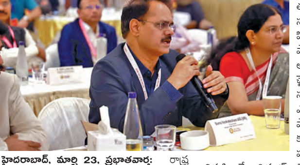
హైదరాబాద్, మార్చి 23, ప్రభాతవార్త: రాష్ట్ర రాజధాని హైదరాబాద్ లో ఈ యేడాది డిసెంబర్ లో.. పబ్లిక్ సర్వీస్ కమిషన్ (పిఎస్సీ) ఛార్జర్ల జాతీయ సదస్సును నిర్వహించే సందర్భంగా సాంకేతికత (టెక్నాలజీ) పాత్ర ముఖ్యమైందన్నారు. నియామక ప్రక్రియలలో అభినాత సాంకేతిక పరిష్కారాలను ఉపయోగించాలి