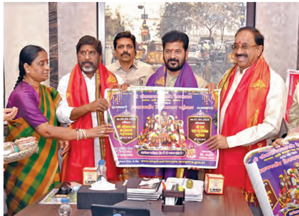
అధికారం సింఘం నివాసంలో శ్రీరామనవమి బ్రహ్మాత్మవాల వారోహిణి సమితి ఆవిష్కరణను ముఖ్యమంత్రి రేవంత్ రెడ్డి, డిప్యూటీ సింఘం భట్టి, మంత్రులు కొండా సురేఖ, తుమ్మల నాగేశ్వరరావు

సింఘం అవ్వనిచిన డిప్యూటీ సింఘం భట్టి విక్రమార్క, మంత్రులు కొండా సురేఖ, తుమ్మల నాగేశ్వరరావు