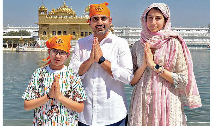
అదివారం అమృత్ సర్ స్వర్ణ దేవాలయంలో మంత్రి లోకేశ్ భార్య బ్రహ్మణి, కుమారుడు దేవాన్స్