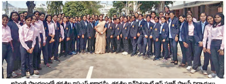
అసెంబ్లీ ప్రాంగణంలో తక్షణం వివేచన అకాడమీ, తక్షణం ఇన్స్టిట్యూట్ ఆఫ్ పబ్లిక్ పాలసీ విద్యార్థులు