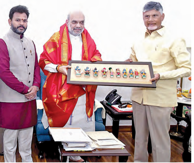
బుధవారం ఢిల్లీలో కేంద్రమంత్రి అమిత్ షాకు జ్ఞాపకము లందిస్తున్న సీఎం చంద్రబాబు