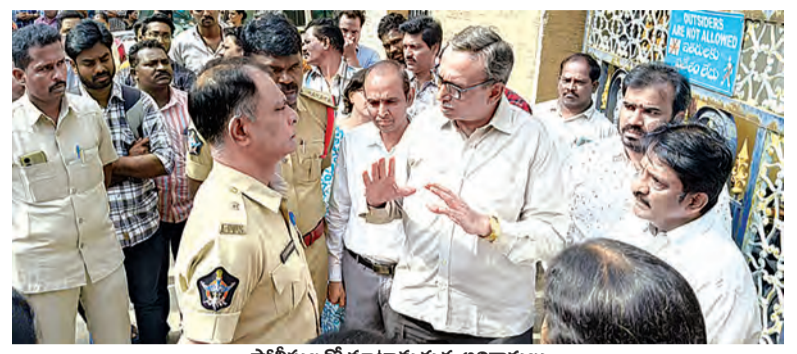
పోలీసులతో మాట్లాడుతున్న అధికారులు

విజయవాడ, మార్చి 5, ప్రభాతవార్త ప్రతినిధి: ఏపీ ప్రభుత్వానికి విభజన హామీలకు అనుగుణంగా అభివృద్ధి చేసేందుకు సహకరించాలని ముఖ్యమంత్రి చంద్రబాబునాయుడు కేంద్ర హోం మంత్రి అమిత్ షాను కోరారు. బుధవారం మధ్యాహ్నం నుంచి సీఎం చంద్రబాబునాయుడు ఢిల్లీ పర్యటనకు వెళ్లారు. ఢిల్లీ ఎయిర్ పోర్టులో ఆయనకు టిడిపి కేంద్రమంత్రులు, ఎంపీలు స్వాగతం పలికారు. అనంతరం చంద్రబాబు కేంద్ర హోంమంత్రి అమిత్ షాను కలిశారు. ఏపీకి చెందిన పలు అంశాలపై అమిత్ షాతో చర్చించారు. రాష్ట్రానికి రావాల్సిన నిధులు, విభజనకు సంబంధించిన పెండింగ్ అంశాలు, అమరావతి, పాలవరం తదితర అంశాలపై కేంద్రమంత్రులతో మాట్లాడారు. పాలవరం, అమరావతి తమ రాష్ట్రానికి అత్యంత కీలక పనులు కానున్నాయని ఈ దిశలో కేంద్రం సహకరించాలని అభ్యర్థించారు. రాష్ట్రంలో ఎన్నో పనితీరులపై అమిత్ షా చంద్రబాబును అభినందించారు. ఎంపీలను ఎన్నికల్లో కూటమి వర్గాలు సమర్థిస్తూ సాధించిన విజయాన్ని అభినందించారు. సమర్థిగా మనం సాధించాల్సిన అంశాలు ఎన్నో ఉన్నాయి, ఆంధ్రాకు >>2