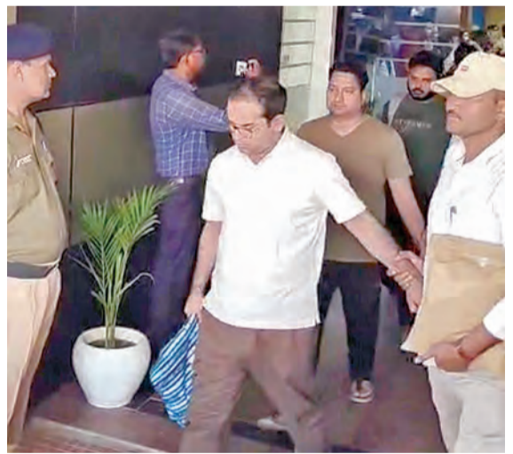
అరెస్టు అయినందుకులను వైద్య పరీక్షల అనంతరం కోర్టుకు తీసుకుళ్తున్న సిబిఐ