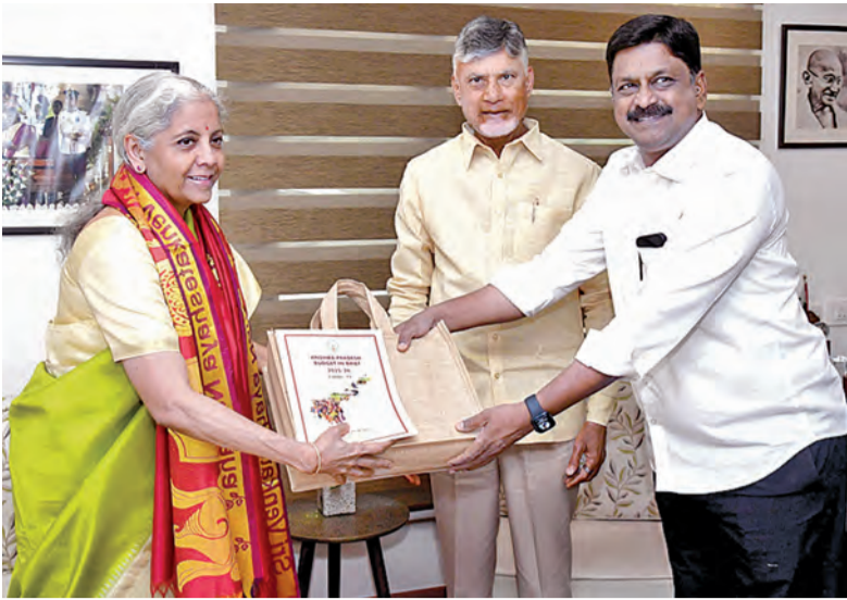
బుధవారం ఢిల్లీలో కేంద్ర ఆర్థిక మంత్రి సీతారామన్ కలిసి జ్ఞాపికను లంఠణిస్తున్న సీఎం చంద్రబాబు, ఆర్థిక మంత్రి పర్యవేక్షణ