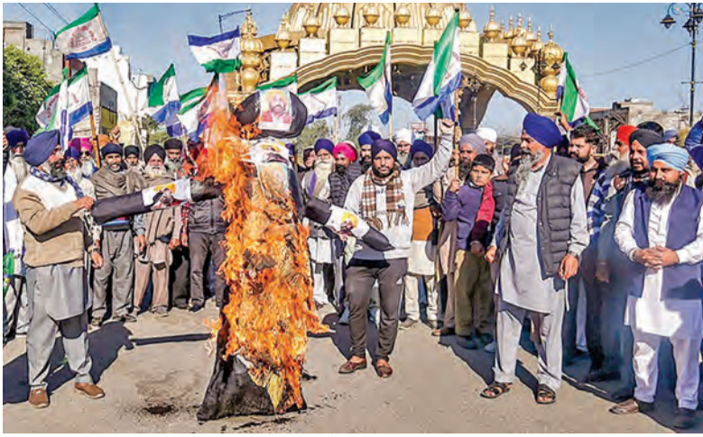
బుధవారం అమ్మత్ నర్తో సీఎం భగవంత్ మాన్ కు వ్యతిరేకంగా ప్రదర్శన జరిపిన కిసాన్ మజ్దూర్ సభ్యులు