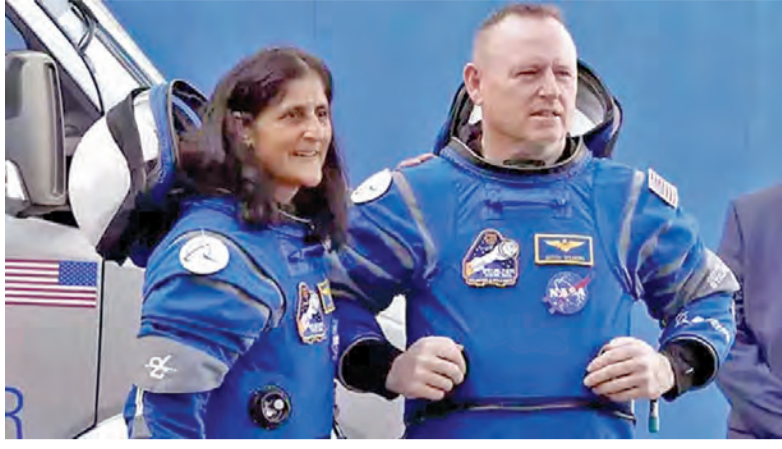
న్యూయార్క్, మార్చి 5: రోడ్డులోకి మూడోసారి వెళ్లిన భారత సంతతి వ్యోమాగామి సునీతా విలియమ్స్ సుమారు తొమ్మిదినెలలుగా అంతరిక్ష కేంద్రంలోనే చిక్కుకుపోయారు. ఆమెతోపాటు వెళ్లిన బవ్విల్లోరీకూడా ఆకాడ్రీ ఉందిపోవాలి వచ్చింది. అలాగే వారిని భూమిపైకి తెచ్చేందుకు బైడెన్ ప్రభుత్వం ఎలాంటి ప్రయత్నం చేయలేదని,