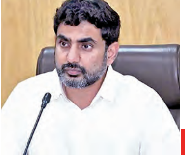
మానసిక వికాసంతోపాటు గెలుపోటములను సమానంగా తీసుకునే స్ఫూర్తి అలవడి, ఆత్మవిశ్వాసం పెరుగుతుందని భావిస్తోంది. ఇందుకు ఢిల్లీ పాఠశాలలో అమలు చేసిన నమూనాపై అధికారులు కసరత్తు చేస్తున్నారు. వేసవి సెలవుల వరకు ప్రయోగాత్మకంగా మంగళగిరి నియోజకవర్గంలోని నిడమర్రు పాఠశాలలో ఈ కార్యక్రమాన్ని అమలు చేయనున్నారు.

మానసిక వికాసంతోపాటు గెలుపోటములను సమానంగా తీసుకునే స్ఫూర్తి అలవడి, ఆత్మవిశ్వాసం పెరుగుతుందని భావిస్తోంది. ఇందుకు ఢిల్లీ పాఠశాలలో అమలు చేసిన నమూనాపై అధికారులు కసరత్తు చేస్తున్నారు. వేసవి సెలవుల వరకు ప్రయోగాత్మకంగా మంగళగిరి నియోజకవర్గంలోని నిడమర్రు పాఠశాలలో ఈ కార్యక్రమాన్ని అమలు చేయనున్నారు. మనమిత్ర వాక్యం గవర్నర్స్ సేవలు 200కు పెంచి సిట్ల మంత్రి నారా లోకేశ్ తెలిపారు. ఈ ఏడాది జనవరిలో 161 సేవలతో ప్రారంభించిన మనమిత్ర అసతి కాలనీనే 200 సేవలు అందించే అద్భుతమైన మైలురాయిని సాధించినట్లు తెలిపారు. ఎపీలో డిజిటల్ గవర్నర్స్ శక్తి ఇవో నిదర్శనమని చెప్పారు. పాఠశాలను మరింత అందుబాటులో తీసుకురావడం సమర్థవంతంగా అమలు చేయడం ద్వారా ప్రజలకు సౌలభ్యం, పారదర్శకతను సులభం చేసింది అభిప్రాయం వ్యక్తం చేశారు. సామాన్య ప్రయోజనం కోసం పాఠశాలను మరింత అందుబాటులో తీసుకురావడం సులభం చేశారు. మన మిత్ర కోసం 955 2300 009 కు సంబంధించి పంపాలని సూచించారు.