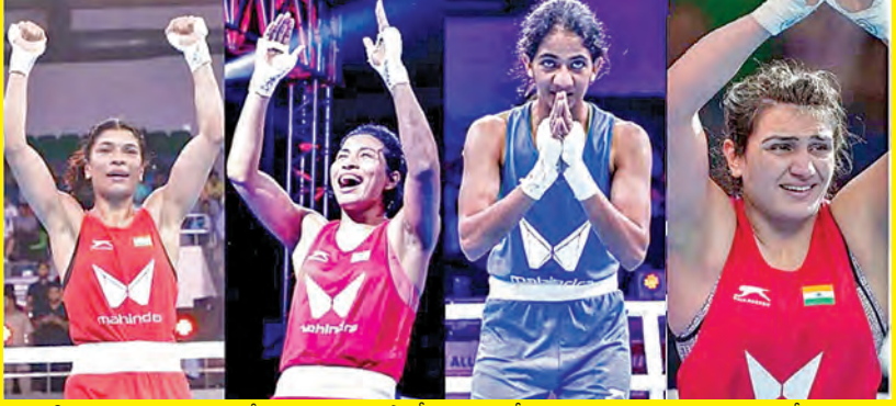
న్యూఢిల్లీ: ఎలైట్ మహిళల జాతీయ బాక్సింగ్ టోర్నీలో, 8వ సీజనుకు సంబంధించి కనెల 21 నుంచి ప్రారంభం కానున్నాయి. ఈ టోర్నీలు గ్రేటర్ నోయిడలోని గౌతమ్ బుద్ధా వర్సటీలో జరగనున్నాయి. యూపీ బాక్సింగ్ అసోసియేషన్, వరల్డ్ బాక్సింగ్ అండ్ బాక్సింగ్ ఫెడరేషన్ ఆఫ్ ఇండియా ఆధ్వర్యంలో ఈ టోర్నీలు