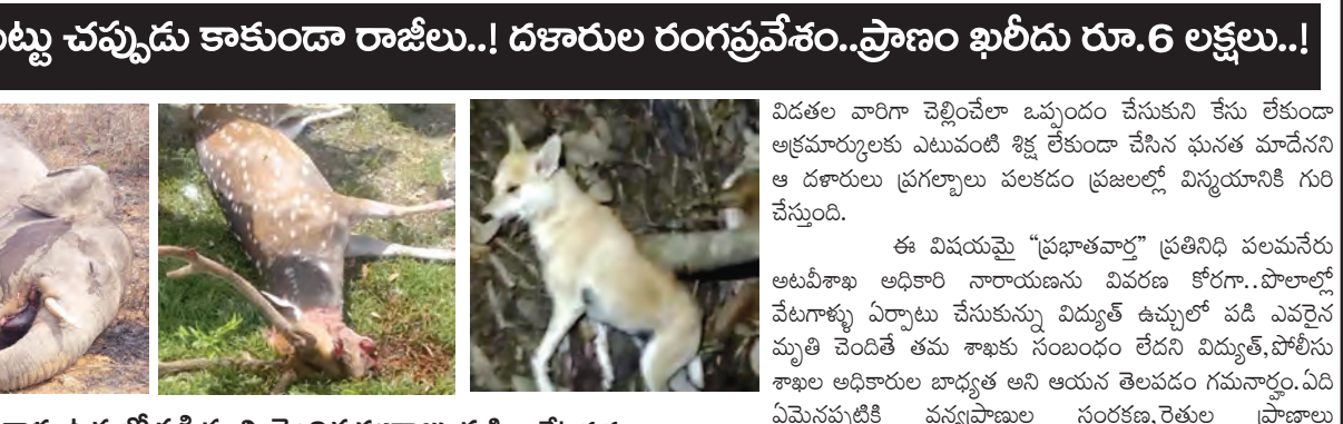
గతంలో వేటాళ్ళ ఉచ్చులో పడి మృతి చెందిన గజరాజు, దుప్పి, వేట కుక్కలు