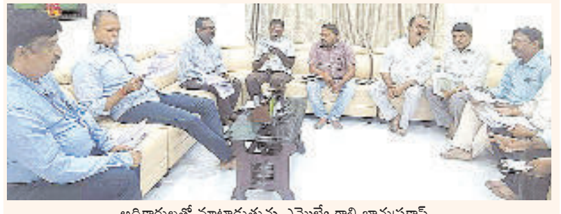
అధికారులతో మాట్లాడుతున్న ఎమ్మెల్యే గౌరీ భానుప్రకాష్

పుత్తూరు, మార్చి 9 ప్రభాతవార్త : రోజురోజుకీ పెరుగుతున్న పుత్తూరు పట్టణ మందిరిని అవసరాల కోసం ఎమ్మెల్యే గౌరీ భానుప్రకాష్ ఒక కొత్త ప్రతిపాదన చేశారు. ఈ ప్రాజెక్ట్ అయ్యే వ్యయాలికి సంబంధించి ప్రభుత్వం నుంచి ప్రత్యేక నిధులు తీసుకోవ్వే ఆలోచన పున్నట్లు ఆయన అధికారులకు తెలిపారు. ఆ మేరకు గూళ్ళూరు చెరువు నుంచి పుత్తూరు పట్టణానికి మంచినీరు సరఫరా చేసేందుకు ప్రతిపాదనలు సిద్ధం చేయాలని ఎమ్మెల్యే గౌరీ భానుప్రకాష్ పుత్తూరు మునిసిపల్, జరిగివన అధికారుల ను ఆదేశించారు. ప్రస్తుతం పుత్తూరు పట్టణానికి మూలకొన నుంచి నీరు సరఫరా అవుతోంది. అలాగే పట్టణంలో వలు ప్రాంతాల్లో బోర్డు వేసి నీరు పంపిణీ చేస్తున్నారు. అయితే నానాటికీ పెరుగుతున్న పుత్తూరు పట్టణ అవసరాలకు ప్రస్తుతం అందుబాటులో ఉన్న నీటి నిల్వలు సరిపోవడం లేదు. భవిష్యత్లో మరింత ఎత్తైన ఎదురవకుండా ముందు జాగ్రత్తగా గూలూరు చెరువు నుంచి పుత్తూరు చెరువు వరకు షెడ్ లైన్ వేస్తారు. పుత్తూరు చెరువు కంటే గూళ్ళూరు చెరువు సుమారు 30 మీటర్ల ఎత్తలో వుండడం వల్ల గ్రామీణీ సే నీరు పుత్తూరు చెరువుకు చేరుతుందని అధికారులు అంచనా వేశారు. త్వరలోనే ఈ ప్రాజెక్టు సంబంధించి ప్రతిపాదనలు సిద్ధం చేయడానికి ఎమెస్సీవల్ కమిషనర్ మంజునాథ్ గౌడ్ ఆధ్వర్యంలో అధికారులు ప్రయత్నాలు ప్రారంభించారు. అలాగే వేసవి కాలాన్ని దృష్టిలో వుంచుకుని నియోజకవర్గంలో మండలాల్లో మంచినీటి ఎత్తడి లేకుండా ముందస్తు చర్యలు చేపట్టాలని అధికారులు ఆదివారం ఆదేశించారు. సమావేశంలో పుత్తూరు, నిండ్ల ఎంపీడిలు ప్రసాద్, శివప్రసాద్ వర్మ, నగరి, విజయపురం ఇన్చార్జ్ ఎంపీడిలు పాల్గొన్నారు.