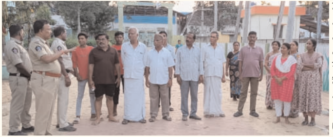
వారికి చేస్తున్న ప్రజలకు సూచనలు ఇస్తున్న పోలీసు అధికారులు

తిరుపతి కార్పొరేషన్, మార్చి 9 ప్రభాతవార్త : తిరుపతి ప్రజలు సంతోషమే పోలీసుల ధ్యేయమని, నేరాలు కట్టడి చేసేందుకే నిఘా ఏర్పాటు చేస్తున్నామని పోలీసులు పేర్కొన్నారు. ఈ సందర్భంగా పోలీసులు మాట్లాడుతూ జిల్లా ఎస్.ఐ. హర్షవర్ధన్ రాజు ఆదేశాల తిరుపతి ప్రజలు సంతోషంగా ఉండాలనే లక్ష్యంతో వారికి చేస్తున్న సమయాలలో పోలీసులు నిఘా ఏర్పాటు చేశారు. మహిళలతో పాటు వృద్ధుల శ్రేయస్సు దృష్ట్యా వైస్ స్టాబిలిగ్, నేరాలు కట్టడి చేసేందుకు వారికి సమయాలలో నిఘా ఏర్పాటు చేశారు. తిరుపతిలో పాటు ప్రధాన నగరాలలో ఉదయం, సాయంత్రం