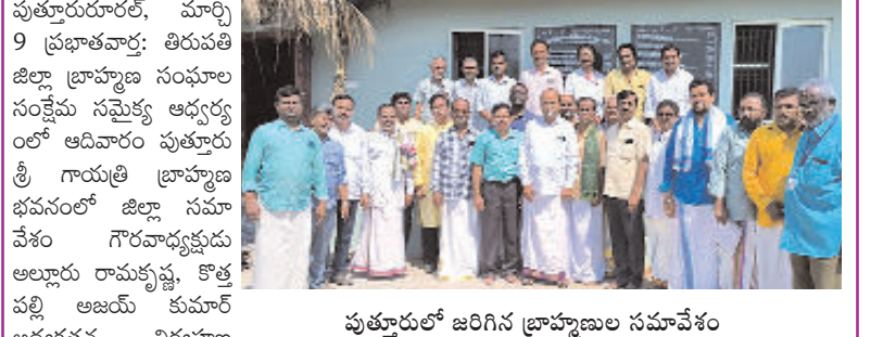
పుత్తూరులో జరిగిన బ్రాహ్మణుల సమావేశం