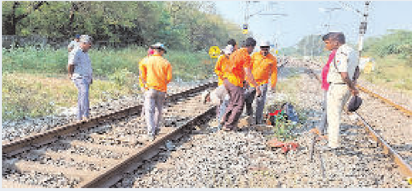
పట్టాలను పరిశీలించి రిపేర్లు చేస్తున్న రైల్వే సిబ్బంది

పీల్చుకున్నారు. రైల్వే పట్టాలు నిజంగా విరిగినాయా లేదా... దీని వెనక ఏదైనా కుట్ర జరిగిందా అని విచారణ చేపడుతున్నారు.