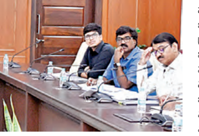
సోమవారం సచివాలయంలో ఇందిరమ్మ ఇళ్లపై మంత్రి పొంగులేటి శ్రీనివాసరెడ్డి అధికారులతో సమీక్ష నిర్వహిస్తున్న దృశ్యం

పక్కపొంగి వ్యవహారాలను పరిశీలించే మేరకు సాంకేతిక పరిజ్ఞానాన్ని ఉపయోగించుకొని అర్హులకు