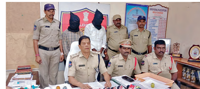
బుధవారం పరాల వెల్లడిస్తున్న డిఎస్పీ రాజేశ్వరరాజు

తెలిపారు. రాష్ట్రంలో కొత్తగా ఏర్పడిన మున్సిపాలిటీలు, కార్పొరేషన్లకు ప్రత్యేకంగా నిధులు కేటాయించాలని తెలిపారు. గ్రీన్ పవర్ కు రాష్ట్ర ప్రభుత్వం పెద్దపీట వేస్తుందిని ఇంధన శాఖ సమావేశంలో డిప్యూటీ సీఎం భట్టి విక్రమార్కు అన్నారు. సప్లై క్యాన్సల్ అనివారించాలని, రెప్ప పాటు కూడా కరెంటు అంతాయం లేకుండా చూసుకోవాలి, వేసవిలో వంటలు ఎండిపోకుండా విద్యుత్తు ఉన్నత అధికారులు నిత్యం పర్యవేక్షణ చేయాలని తెలిపారు. వేసవి నేపథ్యంలో గతంలో ఎన్నడూ లేనివిధంగా విద్యుత్ డిమాండ్ పెరుగుతుంది, అందుకు అనుగుణంగా ప్రణాళికలు సిద్ధం చేసుకోవాలని తెలిపారు. ప్రాధాన్యత రంగమైన ఇంధన శాఖకు ఆ మేరకు బడ్జెట్లో కేటాయింపులు ఉంటాయని డిప్యూటీ సీఎం తెలిపారు. సమావేశాల్లో సైపర్ టీమ్ సృష్టించాలని తెలిపారు. సమావేశాల్లో సైపర్ టీమ్ సృష్టించాలని తెలిపారు. సమావేశాల్లో సైపర్ టీమ్ సృష్టించాలని తెలిపారు. సమావేశాల్లో సైపర్ టీమ్ సృష్టించాలని తెలిపారు.