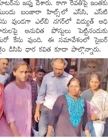
ఇద్దరు యూట్యూబర్లు లిమిండు.

వాటిని పోస్టు చేసినట్లు తెలిపిన అదనపు పోలీసు కమిషనర్ విశ్వప్రసాద్ తెలిపారు. కాగా రేవంత్ నడుతున్న యూట్యూబ్ ఛానల్ వెబ్సైట్ బిఆర్ఎస్ పార్టీ ప్రయోజనం వుందని కొన్ని ఆధారాలు లభించాయని ఆయన తెలిపారు. సింఠంపై అభ్యంతరకర వ్యాఖ్యలు కూడా బిఆర్ఎస్ కార్యాలయంలోనే షూటింగ్ చేసినట్లుగా వుందని ఆయన వెల్లడించారు. ప్రభుత్వంలో ఉన్నతస్థాయిలో వున్న వారిని కింది పదవి విధంగా పోస్టులు పెట్టి సమాజంలో పాపులర్ అయి దండగా డబ్బులు సంపాదించాలని కొందరు యూట్యూబర్లు అనుకుంటే అది సరైనది కాదని, ఈ తరహా పనులపై పోలీసులు కఠినంగా వ్యవహరిస్తారని ఆయన హెచ్చరించారు. పట్టుబడ్డ ఇద్దరు యూట్యూబర్ల వద్ద నుంచి రెండు లాపిటాప్ లతో పాటు రెండు హార్డ్ డిస్కులు, ఒక పేజీ మీడి