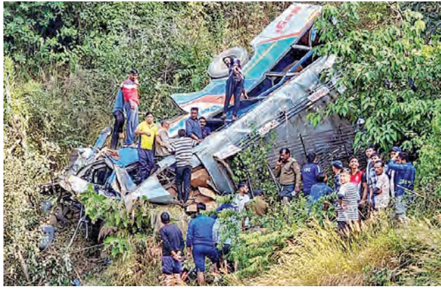
లోయలో పడిన బస్సు

ముగ్గురు మృతి, 13 మందికి గాయాలు ఇంపాల్, మార్చి 12: మజిహూల్ జరిగిన బస్సు ప్రమాదంలో ముగ్గురు సరిహద్దు భద్రతా దళం సిబ్బంది చనిపోయారు. సెక్యూరిటీ సిబ్బందితో వెళ్తున్న బస్సు రోడ్డుపై అదుపుతున్న సేనాని జిల్లాలోని భారీ లోయలో పడిపోయింది. ముగ్గురు చనిపోగా మరొకరు మరణించిన అనుబంధంలో బికిళ్ళు పొందుతున్న చనిపోయారు. మొత్తం 13 మందికి మైగా తీవ్రగాయాలయ్యాయి. ముగ్గురు సైనికుల మృతదేహాలను సేన పతి జిల్లా అనుబంధంలో భద్రపరిచినట్లు పోలీసులు తెలిపారు. ఈ ప్రమాదం వార్త తెలిసిన వెంటనే మజిహూల్ గవర్నర్ ఎకెబిల్లా ప్రగాడ సంతాపం ప్రకటించారు. సేనాని జిల్లాలోని ఛాంగ్-బంగ్ గ్రామం వద్ద జరిగిన ప్రమాదంలో బిసిఎస్ సిబ్బందిని కోల్పోయామని వారి కుటుంబాలకు తన ప్రగాడసానుభూతిని సంతాపాన్ని వ్యక్తం చేస్తున్నట్లు ఎకెబిల్లా సోషల్ మీడియాలో పోస్టు చేసారు. గాయాల పాలయిన వారు సత్కరణలు కోలుకోవాలని ఆశించారు.