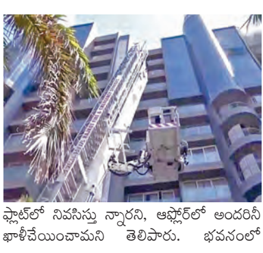
ఫైర్ లో నివసిస్తున్నారని, ఆఫ్లో అందరినీ భాజీ చేయించామని తెలిపారు. భవనంలో

రాజ్ కోట్ (గుజరాత్), మార్చి 14: గుజరాత్ లోని రాజ్ కోట్ లో శుభవారం ఉదయం ఆగ్లాంటిన్ భవనంలో మంటలు వెలరేగడంతో ముగ్గురు వ్యక్తులు ప్రాణాలు కోల్పోయారు. సమాచారం అందుకున్న వెంటనే రాజ్ కోట్ ఫైర్ ఎమ్బులెన్స్ సేవల అధికారులు ప్రమాదస్థలానికి చేరుకుని మంటలను అదుపులోకి తెచ్చారు. ఎన్ఫీ బిజ్ వాడరి మాట్లాడుతూ ముగ్గురు ప్రాణాలు కోల్పోయారు, మరొకరి తీవ్ర గాయాలయ్యాయని ఆసుపత్రికి తరలించినట్లు తెలిపారు. వీరంతా కూడా భవనంలోని ఒకే