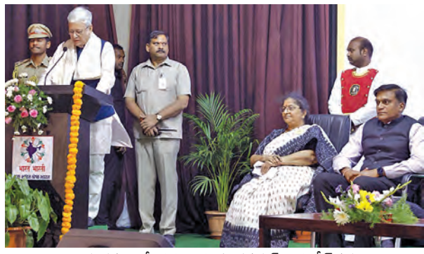
కార్యక్రమంలో ప్రసంగిస్తున్న గవర్నర్ జిష్ణుదేవ్ వర్మ