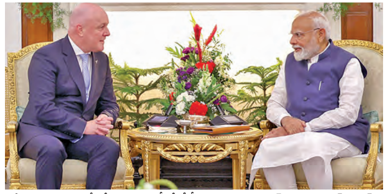
సోమవారం న్యూఢిల్లీలో ప్రధాని మోదీతో భేటీ అయిన న్యూజిలాండ్ పిఎం క్రిస్టోఫర్ లక్సన్

బిల్లులు ఆమోదం పొందిన అనంతరం శాసనసభ మంగళవారానికి వాయిదా పడింది. అంతకు ముందు సిఎం రేవంత్ రెడ్డి సభలో మాట్లాడుతూ సామాజిక, ఆర్థిక, రాజకీయ అంశాలపై కులగణన చేసిన మొదటి ప్రవేశపెట్టిన తీర్మానం కాదని బిల్లు అని స్పష్టం చేశారు. చట్టపరంగా సాధించుకునేందుకు నాయకత్వం వహించేందుకు సిద్ధంగా ఉన్నామని, ఈసారి 4 ఎమ్మెల్యే స్థానాలను ఎస్సీ, ఎస్టీ, టీసీలకే ఇవ్వాలని ఆయన ఆసంబ్లిలో గుర్తు చేశారు. 1979లో మండల్ కమిషన్ వేశారని, మండల్ కమిషన్ తోనే టీసీ రిజర్వేషన్లకు చట్టబద్ధత ప్రారంభమైందని సిఎం ఆన్నారు. టీసీ రిజర్వేషన్లు పెంచుతామని కామారెడ్డి డిక్లరేషన్ లో ప్రకటించామని గుర్తు చేశారు. కులగణన, టీసీ రిజర్వేషన్ల అంశాన్ని ఏడాదిలోపు ప్రక్రియను పూర్తి చేశామని తెలిపారు. టీసీ రిజర్వేషన్లు పెంపు అంశంపై మద్దతు ఇస్తున్న అందరికీ సిఎం ధన్యవాదాలు తెలిపారు. కేంద్రం నుంచి అంగీకారం కోసం పోరాడుతానన్న సిఎం రేవంత్ రెడ్డి ప్రధాని మోదీని కలిసేందుకు అన్ని పార్టీల నేతలు ముందుకు రావాలని పిలుపునిచ్చారు. చట్టసభల్లో టీసీలకు రిజర్వేషన్లు కల్పించేలా రాజ్యాంగ సవరణ జరగాలని వెల్లడించారు. అవసరమైన రాజ్యాంగ సవరణ జరిగేలా అందరం కలిసి